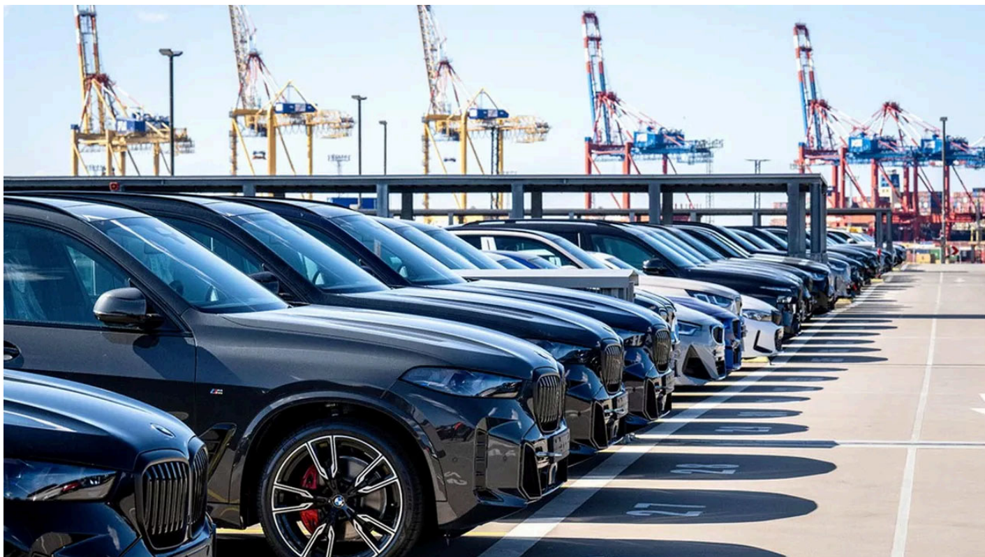
Des voitures allemandes sont chargées sur des navires au port de Bremerhaven, en Allemagne. Les droits de douane américains pèsent lourdement sur les exportations automobiles européennes.

L'excédent commercial de l'Union européenne a fondu de près d'un tiers au deuxième trimestre. L'impact des droits de douane américains a commencé à se faire sentir, mais l'Europe connaît aussi une rapide dégradation de sa balance commerciale avec la Chine.