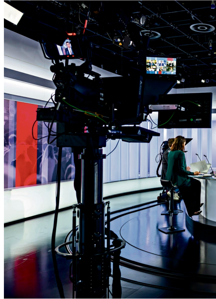
Dans les studios de la RTS, hier, lors de l'émission spéciale consacrée aux votations. (GENÈVE, 8 MARS 2026 /)