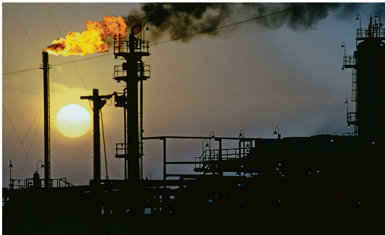
Une raffinerie au Qatar.

MARCHÉS Les cours du baril de brut ont franchi hier les 100 dollars le baril, au dixième jour de la guerre au Moyen-Orient, plongeant les bourses dans une nouvelle séance sous haute tension alors que s'éloignent les espoirs d'une résolution rapide du conflit