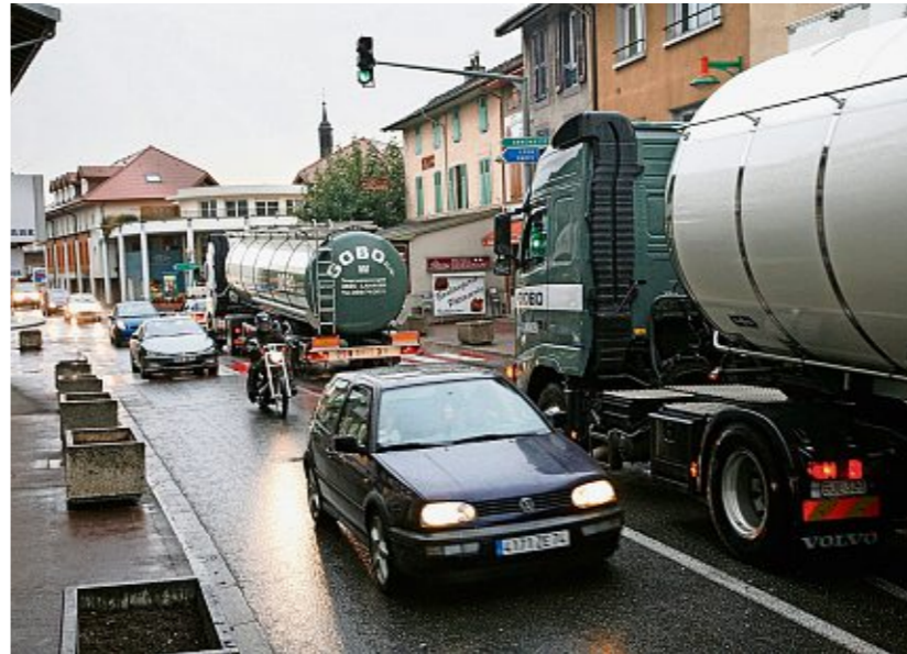
La circulation de transit dans les communes frontalières génère des nuisances pour les habitants, comme ici à Douvaine, en Haute-Savoie.

Pour tenter de ralentir cette expansion, les maires français brandissent désormais l'arsenal législatif de leur pays, et notamment la loi zéro artificialisation nette des sols (ZAN). «Cet outil juridique, pensé à l'origine pour des questions environnementales, peut permettre de refuser l'urbanisation», indique Vincent Kaufmann. Conséquence: les travailleurs frontaliers sont contraints de reculer tou-