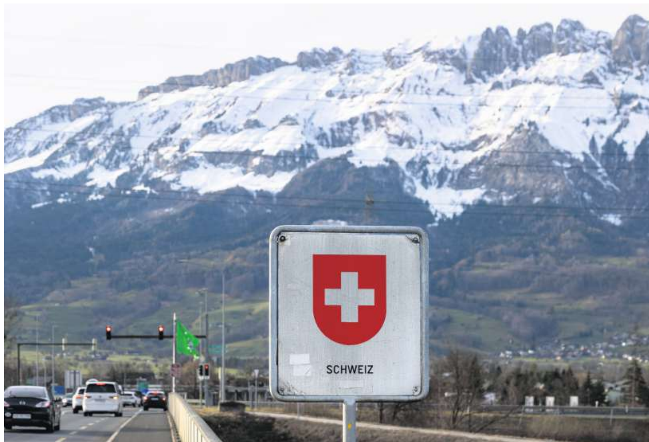
Wer darf rein? Die SVP will die Zuwanderungspolitik neu regeln, die Wirtschaft ist alarmiert.

Im Streit um die 10-Millionen-Schweiz sagen die Dachverbände, die Partei wolle «die Arbeitsmigration vollständig abwürgen»