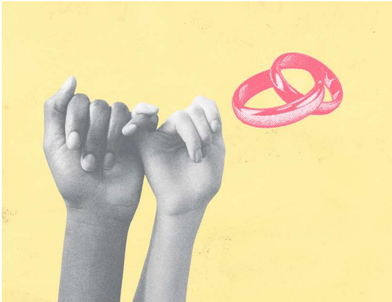
Heiraten oder nicht? Manche Paare müssen deswegen mehr Steuern bezahlen, aber beileibe nicht alle.

Das gilt auch für Familien mit Kindern. Nehmen wir an, ein Paar hat zwei Kinder und einen Nettolohn von gut 180 000 Franken. Je nachdem, wie dieses Einkommen unter den zwei Partnern aufgeteilt ist, würden sie künftig