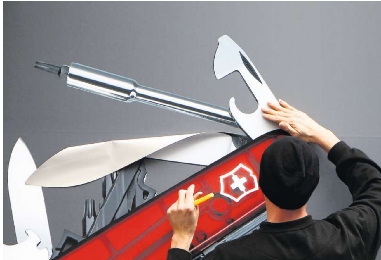
Bis Unternehmen wie Victorinox die zu viel bezahlten Zölle zurückerhalten, kann noch viel Zeit verstreichen.

«Es ist davon auszugehen, dass es noch einige Zeit dauern wird, bis geklärt ist, ob die Rückforderung von bereits bezahlten IEEPA-Zöllen möglich ist», heisst es auch vom Staatssekretariat für Wirtschaft (Seco). Ähnlich äussert sich der Wirtschaftsdachverband Economiesuisse. Zu-