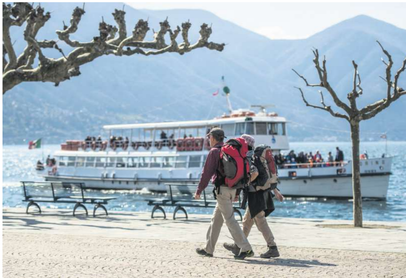
Jeder vierte männliche Beschäftigte geht heute vor dem 63. Altersjahr in Pension. Wanderer in Ascona.

Die Frühpensionierung ermöglicht den Betroffenen bis jetzt einen Ausweg, damit sie trotzdem in ihrer PK blei-