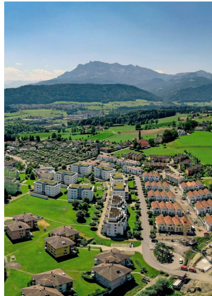
In Emmen sind die finanziellen Aussichten weniger erfreulich als der Blick auf den Pilatus. Bild: Alamy

Quelle: gemeindeeffizienz.ch, eigene Berechnung/Grafik: mlr