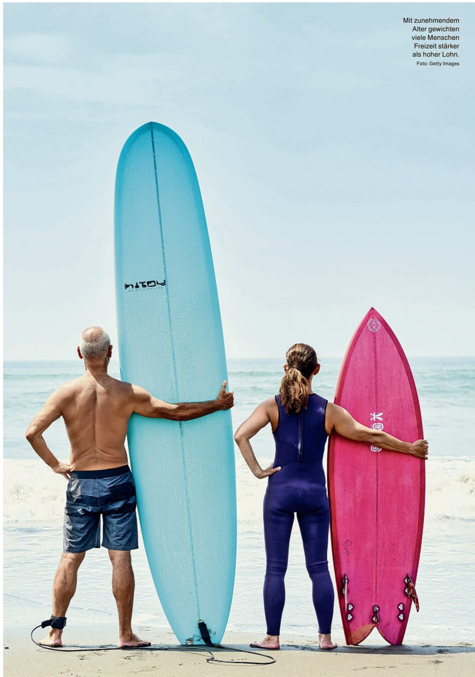
Mit zunehmendem Alter gewichten viele Menschen Freizeit stärker als hoher Lohn.