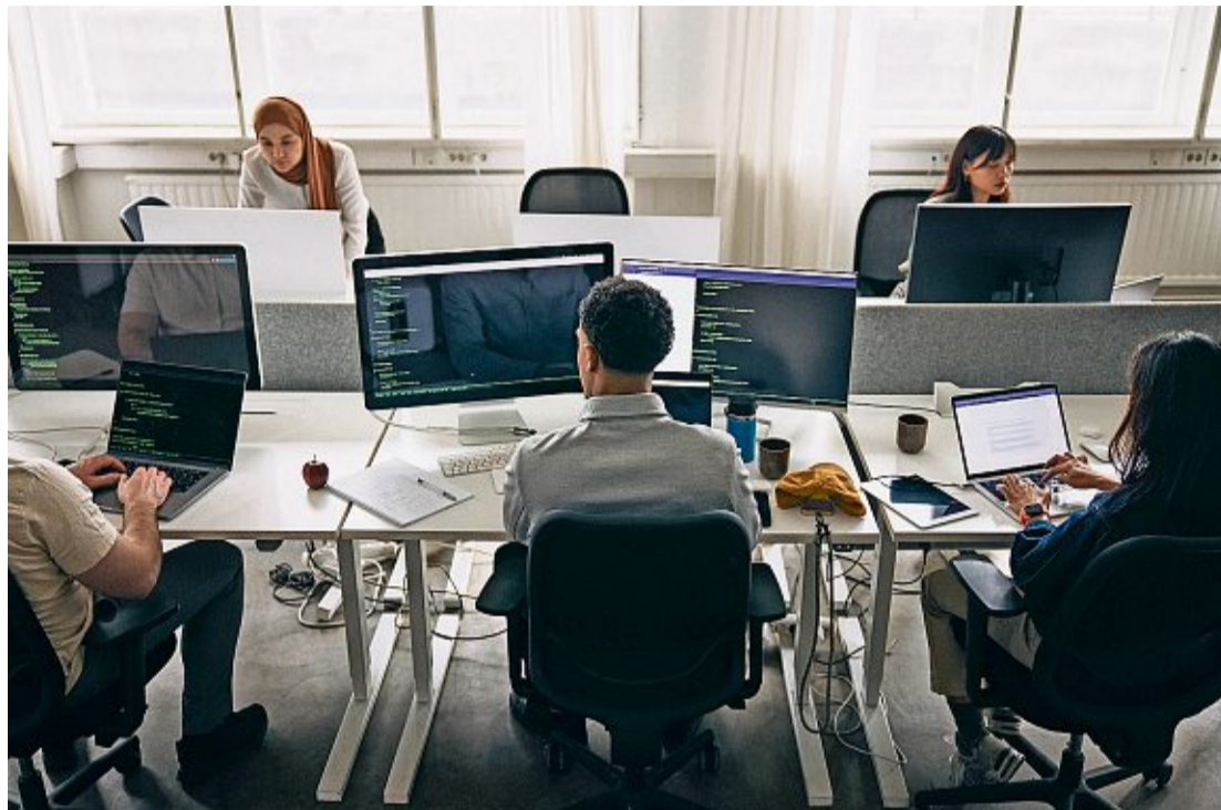
Werden Mitarbeiter durch KI-Anwendungen bald hyperproduktiv – oder gleich ganz ersetzt?

Forscher haben in den letzten Jahren versucht, dies abzuschätzen. Ihre Mutmassungen gehen auseinander. Der Nobelpreisträger Daron Acemoglu kam vor zwei Jahren bloss auf einen Wert von 0,2 Prozentpunkten: Um nur