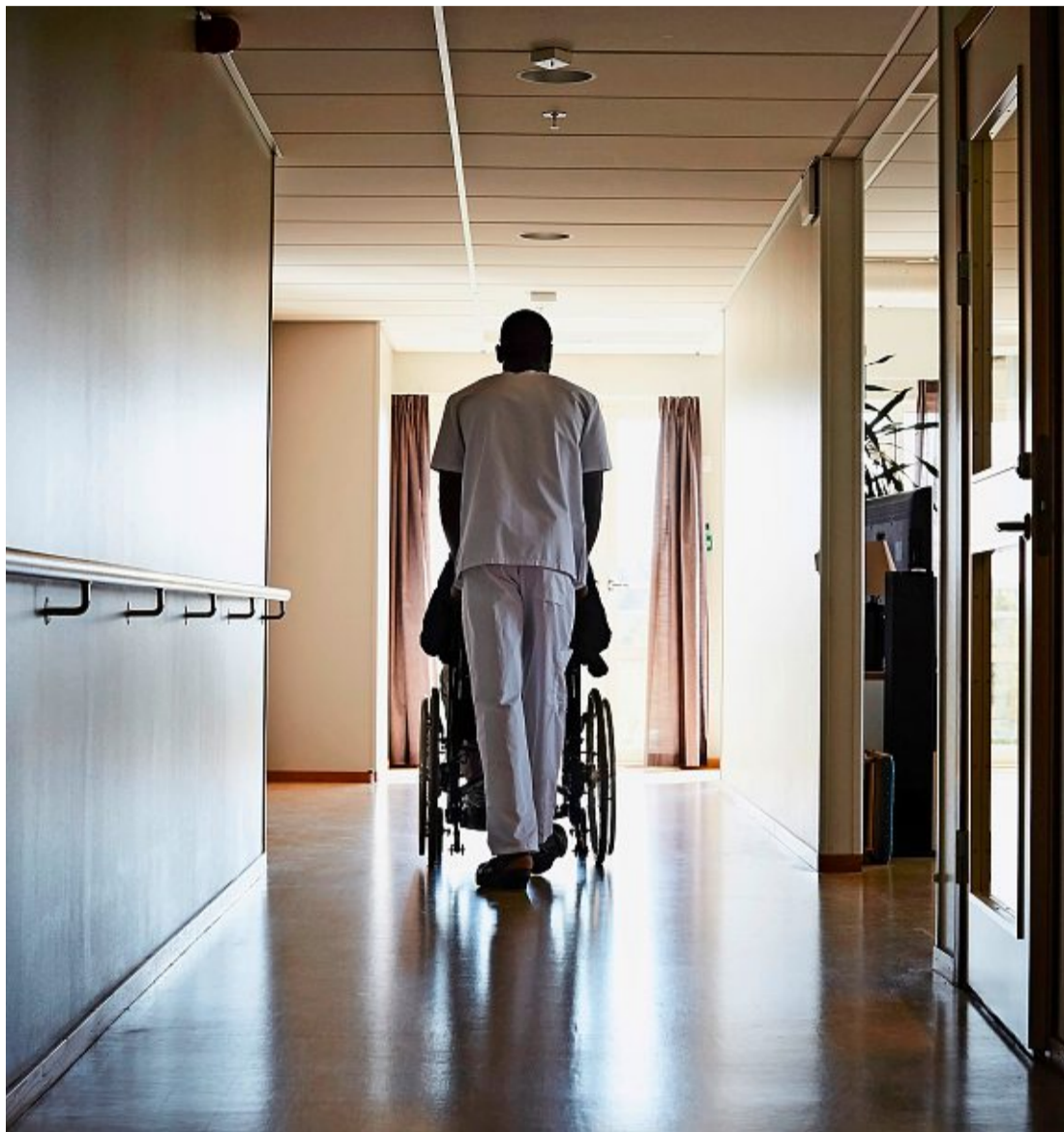
Pflegefachpersonen sind in der Schweiz dringend gesucht, viele Jobs bleiben unbesetzt.

Der Spitalverbund Appenzell Ausserrhodens hat deshalb den