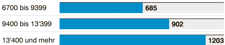
Grafik: zeg / Quelle: SRF

Monatseinkommen und Mehrbelastung, in Fr.