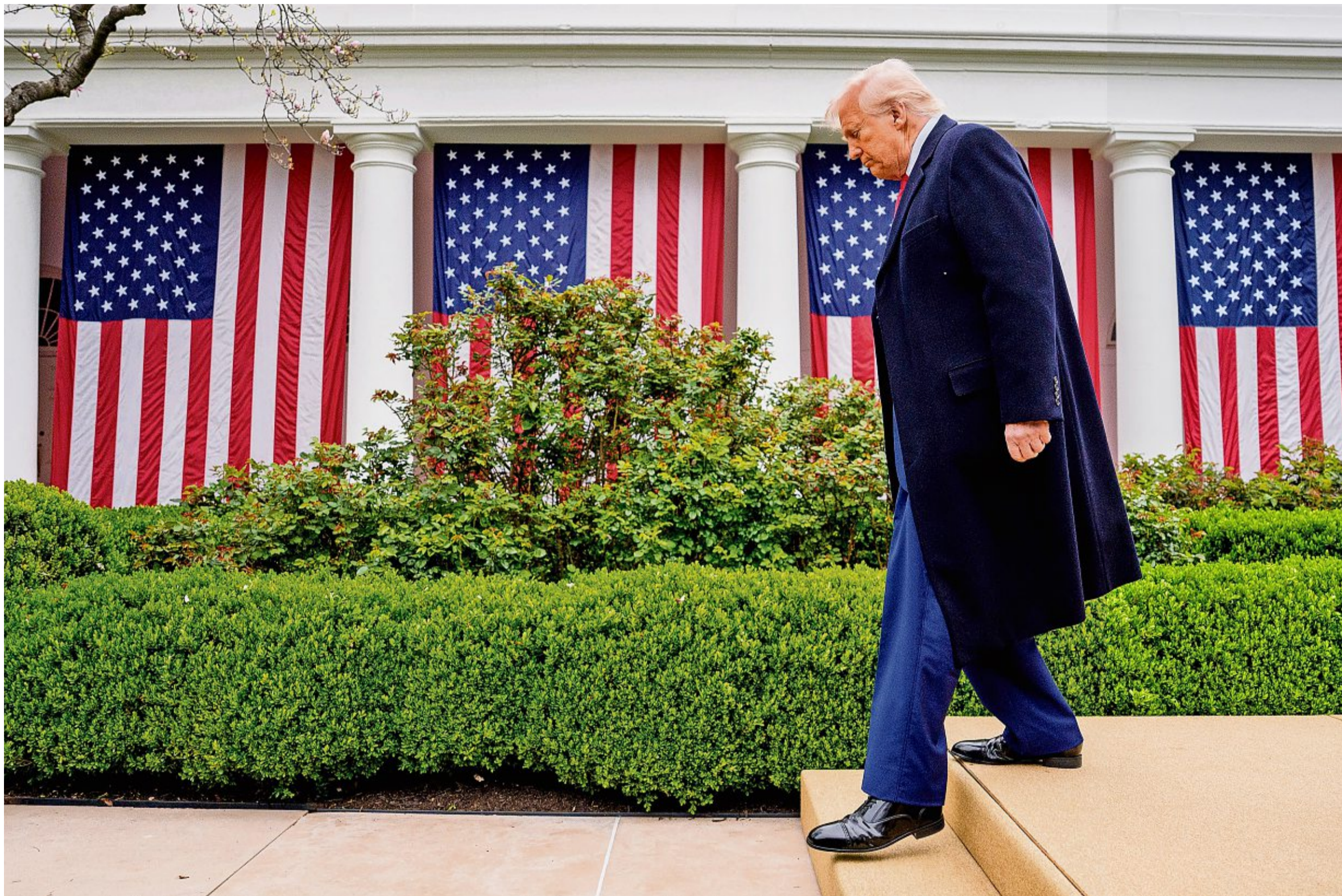
Trump verlässt im vergangenen April die Bühne, nachdem er die Welt mit seinen Zöllen überrascht hat.

Wie viel es am Schluss tatsächlich sein wird, ist ungewiss. Viele der angekündigten Investitionen