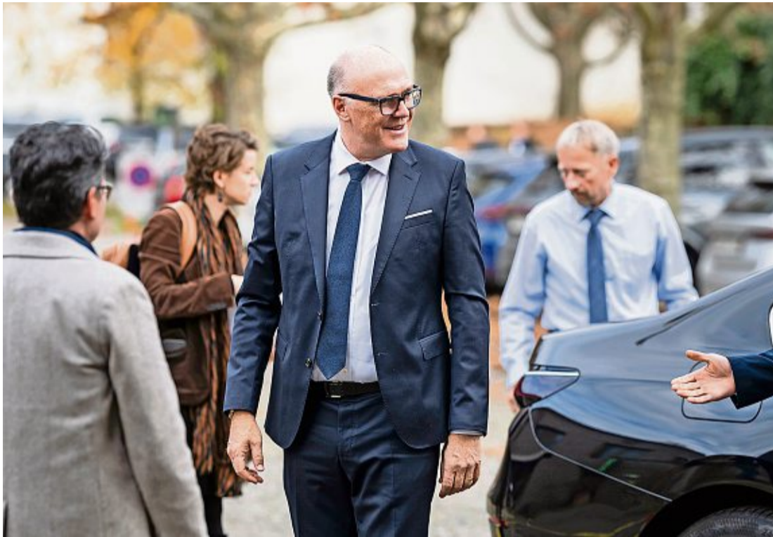
Le Conseiller fédéral Martin Pfister, qui combat l'initiative pour le service citoyen, peut avoir le sourire.

Bien que le non se soit là aussi renforcé partout, on trouve encore une différence d'appréciation selon les sexes. Les femmes, qui seraient directement concernées par un élargissement de