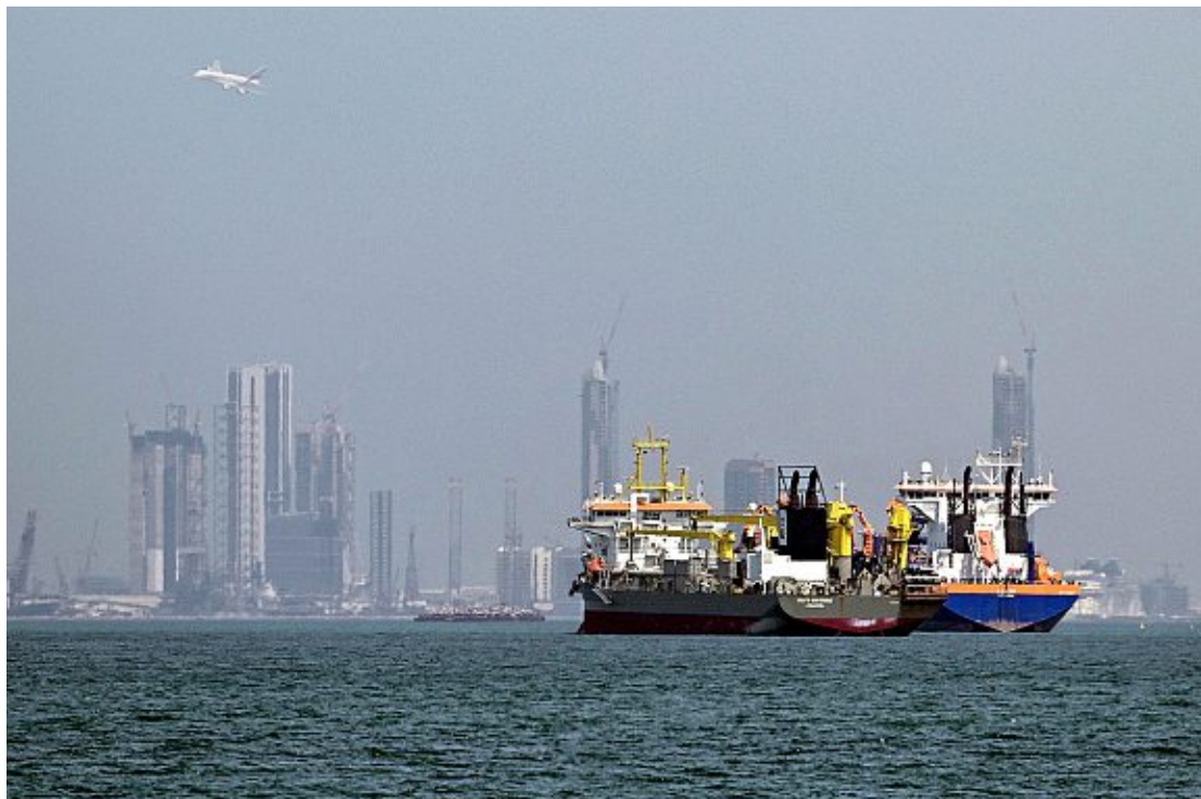
S'il amène son lot de difficultés économiques, le désordre au Proche et Moyen-Orient consécutif au conflit armé entre l'Iran, les États-Unis et Israël pourrait aussi embellir les finances publiques genevoises.

La facture genevoise 2026 atteint 543 millions, faisant de