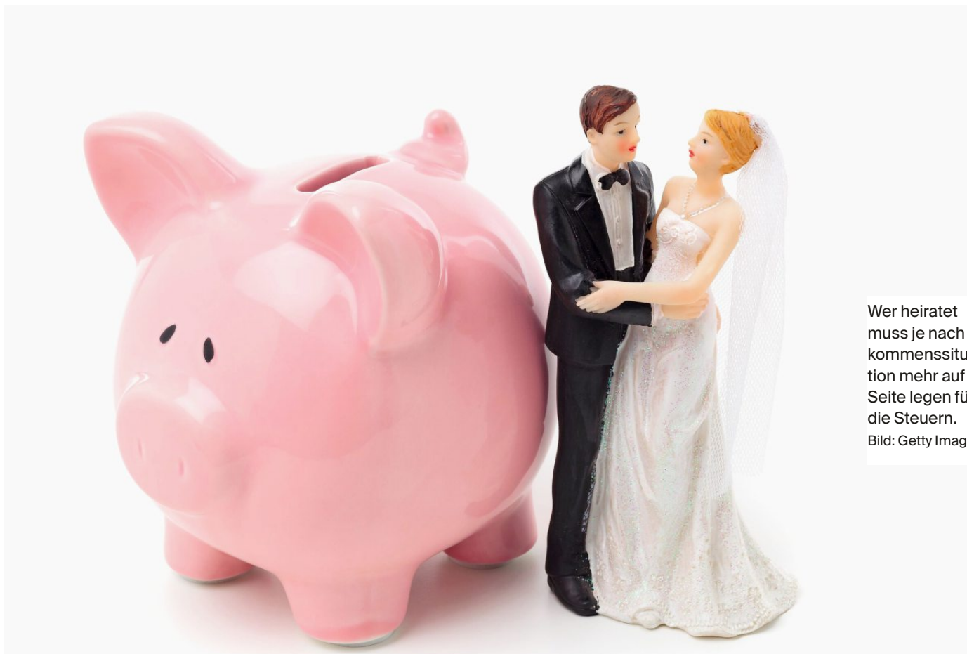
Wer heiratet muss je nach Einkommenssituation mehr auf die Seite legen für die Steuern.

Die Kantone sagen, sie hätten die Heiratsstrafe abgeschafft. Doch stimmt das?