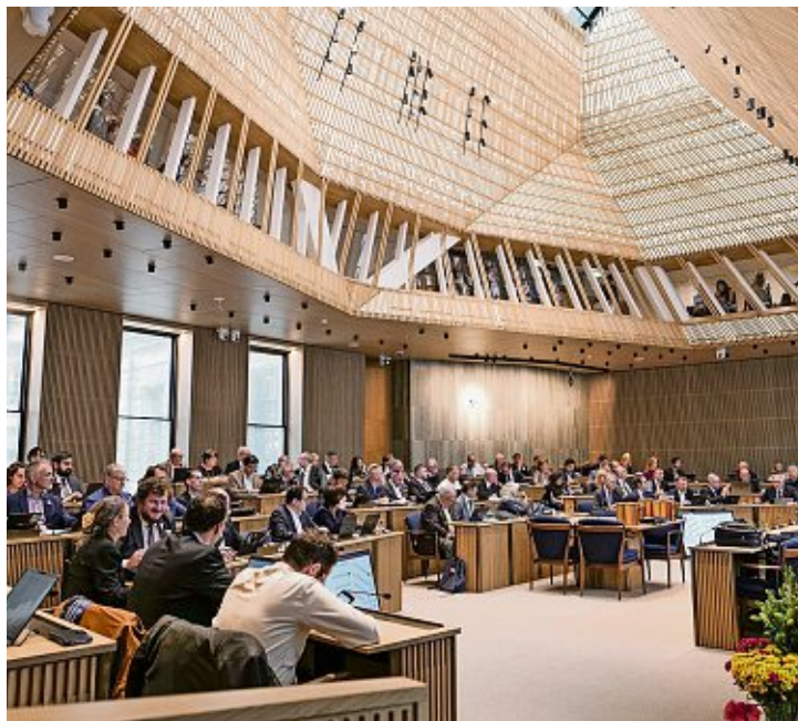
Les deux formations de droite ont déposé une proposition de résolution pour annuler l'assemblée prévue le 12 mars.