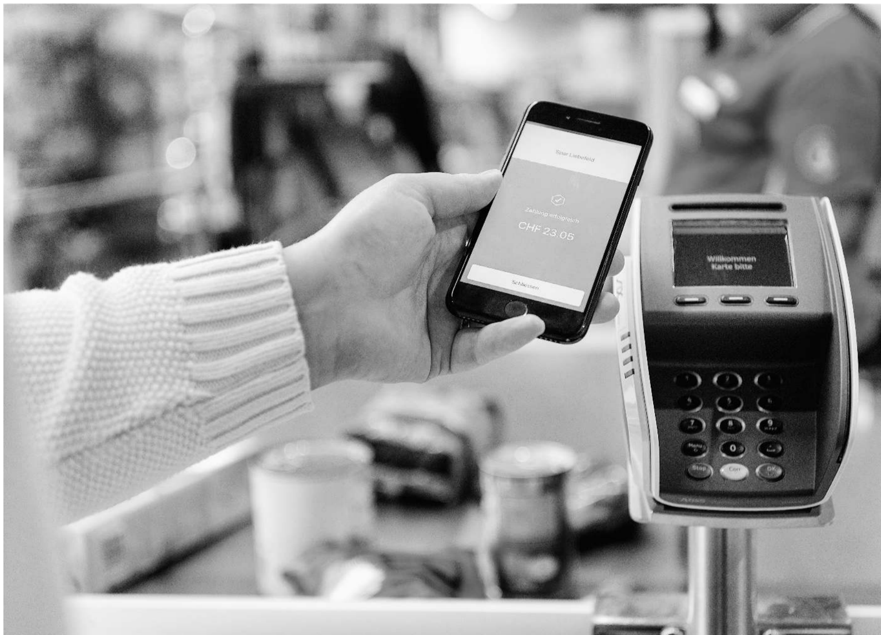
Les applications mobiles interviennent dans près d'un achat en magasin sur cinq en Suisse.

En attendant, Twint se montre sereine. «Il est dans notre intérêt de proposer des frais compétitifs», indique une porte-parole de la société qui appartient à plusieurs établissements financiers. La Banque cantonale vaudoise, Postfinance, Raiffeisen, UBS et la Banque cantonale de Zurich font notamment partie de son actionnariat. La firme réfute par ailleurs l'affirmation selon laquelle son service serait «généralement cher». «Selon le prestataire, les frais pour les paiements se situent souvent à un niveau de prix comparable à celui des paiements par carte de débit, voire parfois inférieur. Et, dans la majorité des cas, ces frais sont nettement plus avantageux que les