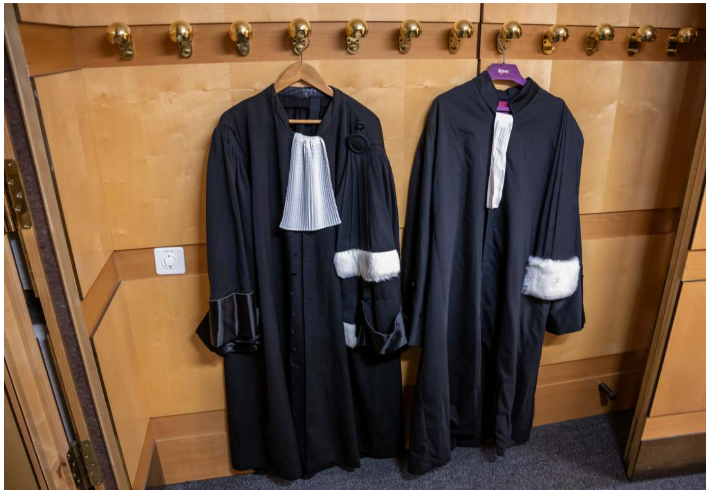
Les professions juridiques évoluent et requièrent de nouvelles compétences.

D'après le professeur, les tâches assumées par l'IA amènent assurément un gain de temps. Toutefois, de nouvelles exigences découlent de cette