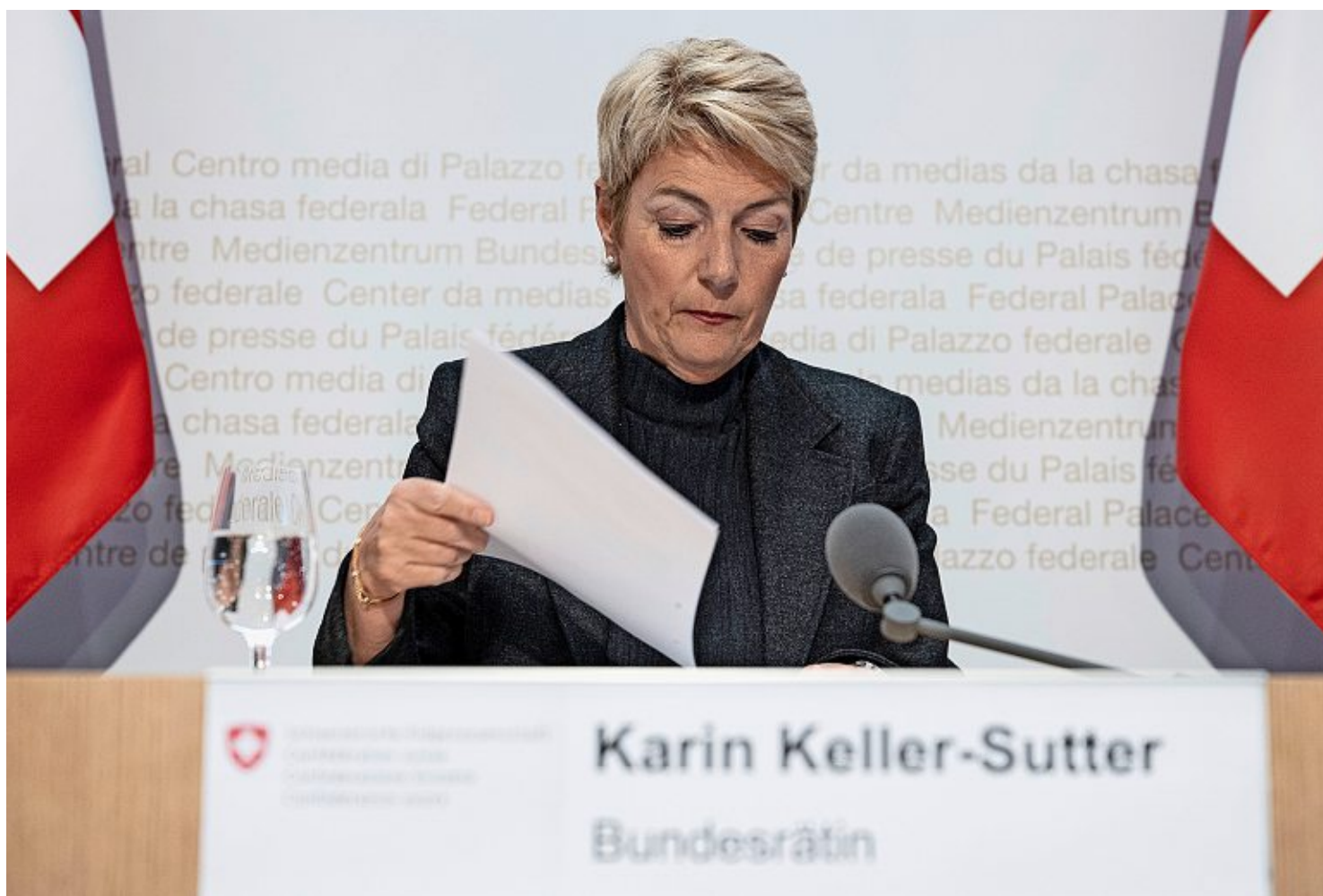
La ministre des Finances, Karin Keller-Sutter, a appelé mercredi à maintenir un plan d'allègement, malgré des comptes à l'équilibre.