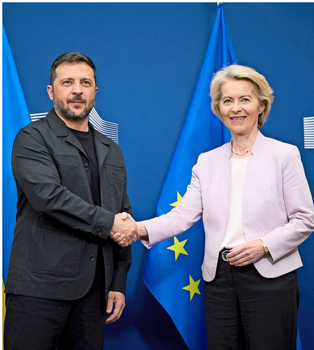
Aufeinander angewiesen: Wolodymyr Selenskyj, der Präsident der Ukraine, und EU-Kommissions-Chefin Ursula von der Leyen im August 2025 in Brüssel.

Zugleich sind sich in Brüssel alle bewusst, in welches Dilemma die geforderte Blitzaufnahme der Ukraine die EU stürzt. Ein hoher EU-Diplomat sagte der «Financial Times»: «Es ist eine Falle, die Trump und Putin uns