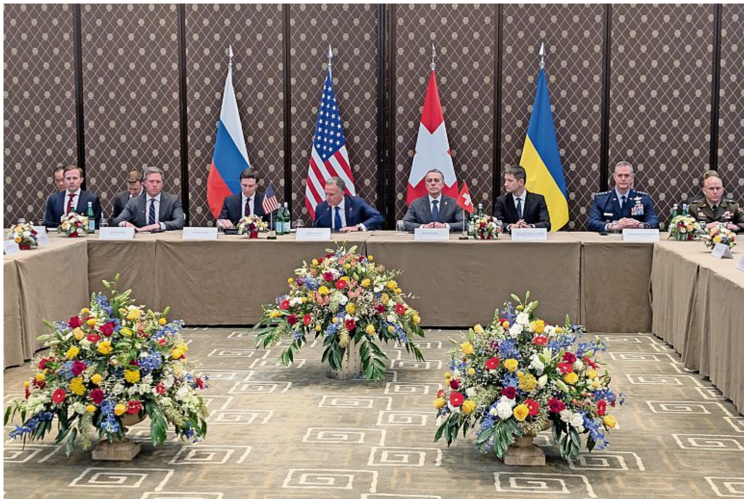
Les pourparlers menés durant deux jours au bout du lac n'ont pas débouché sur des avancées concrètes dans le conflit russo-ukrainien.

Les Ukrainiens sont en revanche prêts à évoquer la création d'une zone démilitarisée dans