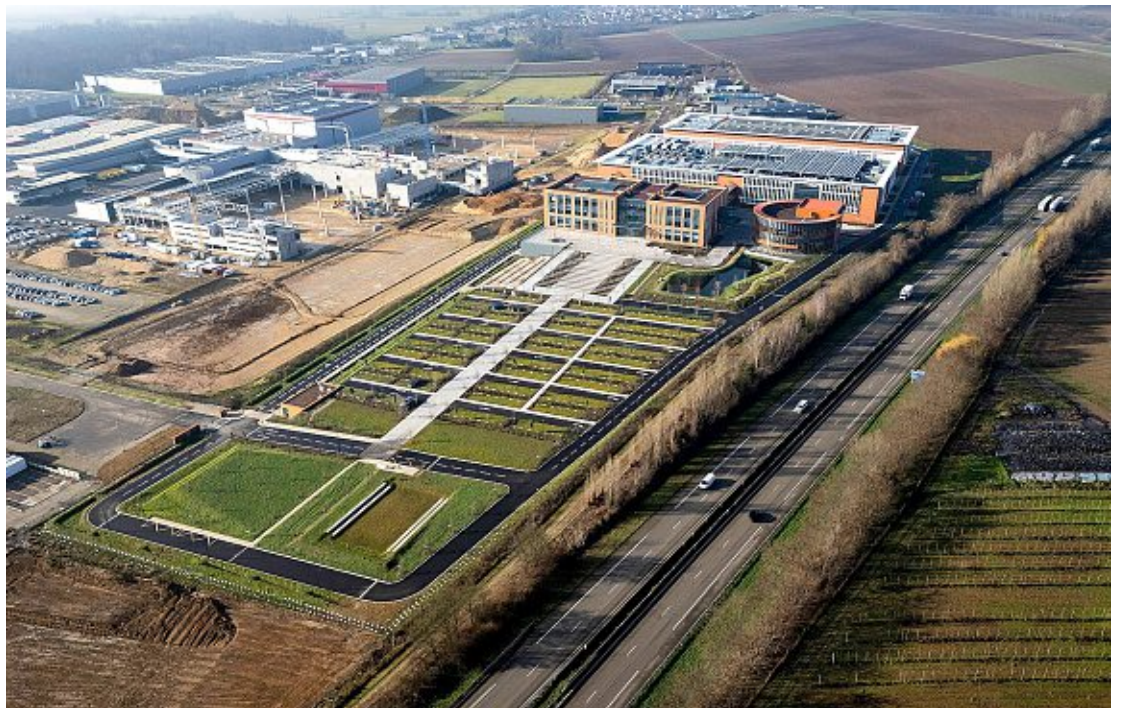
Vue aérienne de l'usine Huawei à Brumath, France, avec des bâtiments modernes.

Les données de l'étude montrent ce phénomène. Sur la période 2016-2020, les entreprises chinoises ont consacré en moyenne 334 milliards de dollars aux investissements industriels domestiques. Sur les cinq années suivantes, ils étaient tombés à 252 milliards par an. Et le mouvement s'accélère puisque,