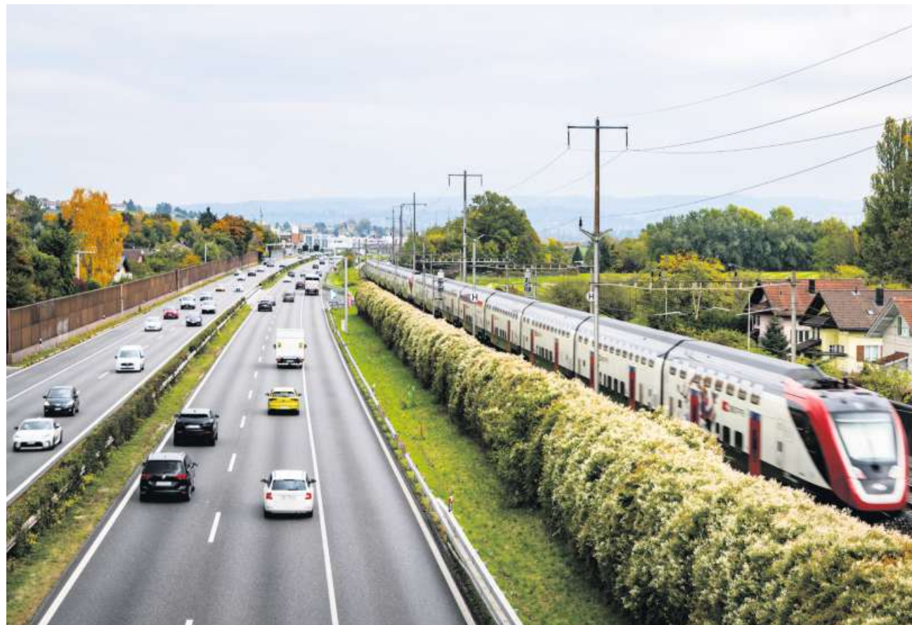
Nicht nur Neubauten kosten Geld, sondern auch der Unterhalt der bestehenden Bahninfrastruktur. Im Bild ein Abschnitt bei Morges am Genfersee.

Röstis Strategie, möglichst viele Regionen zufriedenzustellen, hat ihren Preis. Für das darauffolgende Ausbaupaket 2031 hat die Regierung bereits Vorentscheide gefällt, die weitere Investitionen in der Höhe von rund 8 Milliarden Franken auslösen sollen. Sie plant unter anderem einen Tiefbahnhof in Basel SBB mit einer Durchmesserlinie zum Badischen Bahnhof. Da solche Vorhaben, wie auch in Luzern, nur in Etappen realisierbar sind, ist über Jahrzehnte