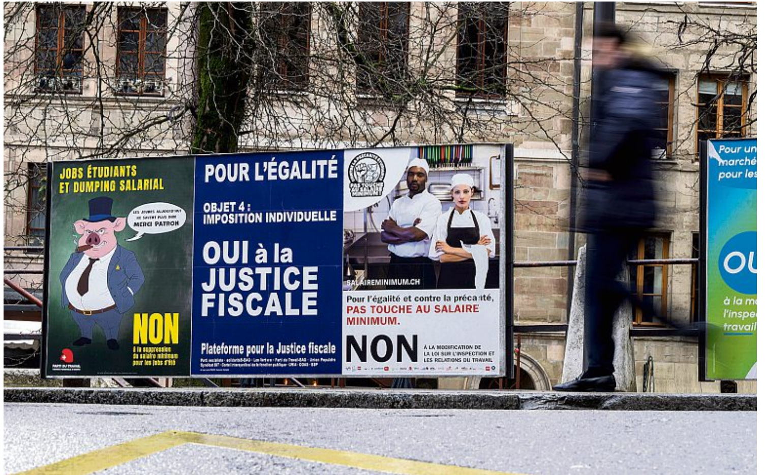
Le 8 mars, il y a non seulement plusieurs votations fédérales au menu, mais aussi plusieurs scrutins cantonaux. Ici, une photo prise à Genève.

En effet, si les deux époux perçoivent un salaire similaire, ils paient en général plus d'impôt que les couples non mariés à la Confédération (impôt fédéral direct), mais aussi dans certains cantons: c'est la pénalisation. Par contre, si le revenu est inégalement réparti au sein du couple, les époux paient en général moins que les concubins, aussi bien d'IFD que d'impôts cantonaux: c'est le bonus. Or, un