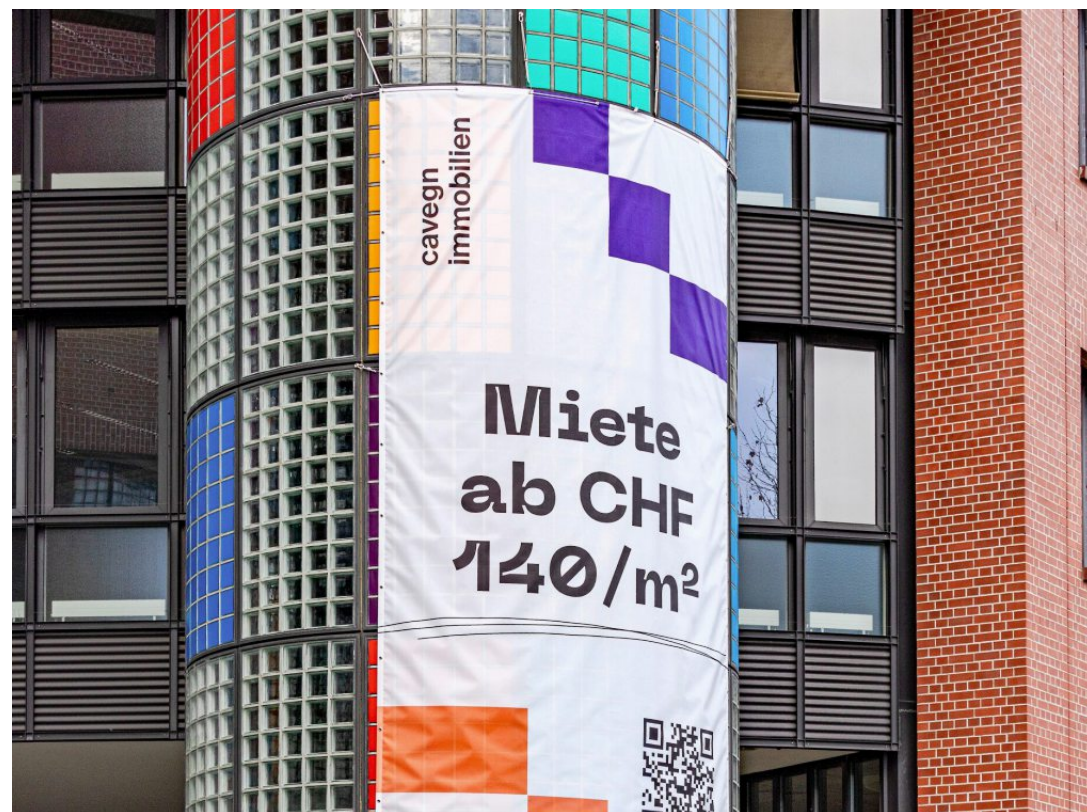
Stehen seit vielen Monaten leer: Büroflächen in einem Gebäude in Opfikon ZH.

Anders als in den USA sind hierzulande vor allem Agglomerationen betroffen. In Innenstädten und an zentralen Lagen gehen Büros in den meisten Fällen noch immer gut weg, auch wenn es Ausnahmen gibt. Firmen wollen lieber kleinere, dafür zentra-