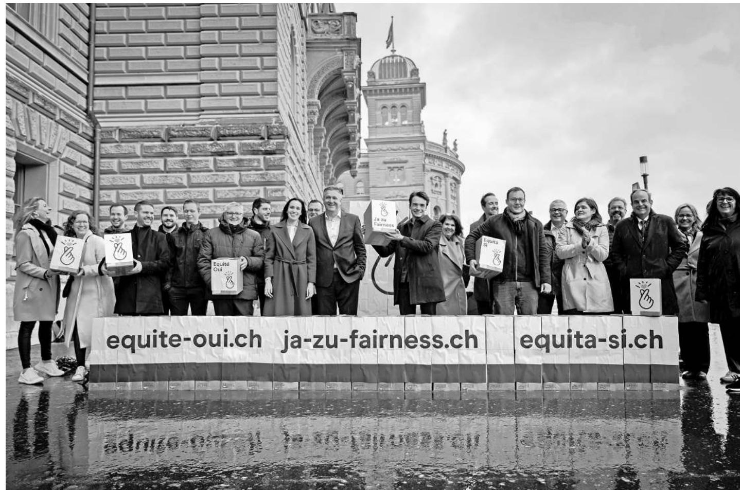
Le Centre a déposé il y a deux ans deux initiatives populaires pour défendre les couples mariés face au fisc et face aux rentes AVS.

Plusieurs votes cruciaux de la réforme soumise au peuple le 8 mars se sont faits à une voix près au Conseil des Etats. Et en cas de non dans les urnes, le bras de fer promet de se pour-