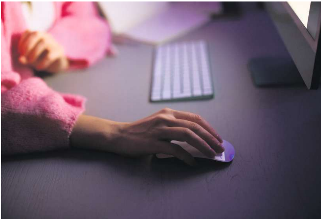
In unsicheren Zeiten versenden Stellensuchende Bewerbungen häufig im Akkord – künstliche Intelligenz erleichtert ihnen das.

Die schärfere Konkurrenz um Jobs zeigt sich auch auf anderen Plattformen. Bei LinkedIn ist die Zahl der Bewerbungen pro Stelle in Deutschland im Vergleich zum Vorjahr um 15 Prozent gestiegen. Separate Zahlen für die Schweiz werden nicht angegeben. Barbara Wittmann, die bei LinkedIn die Region