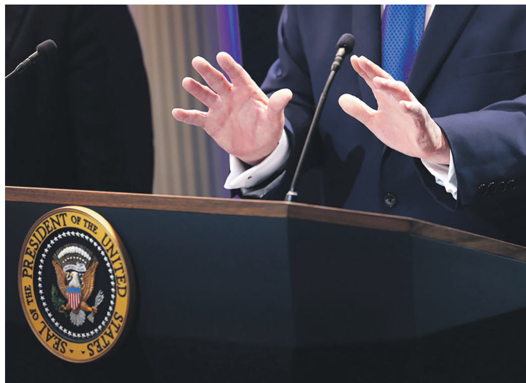
Maison-Blanche. Malgré son revers devant la Cour suprême, Donald Trump, ici lors de sa conférence de presse vendredi, ne veut pas abandonner sa guerre commerciale.

Soyons clairs: l'impact immédiat sur les exportateurs suisses sera probablement limité, parce que l'ancien droit (de douane) était de 15% et le nouveau est de 15%. Là où il y a un problème, tant pour les entreprises que pour les négociateurs suisses, c'est que ces 15% ne s'appliquent que pendant 150 jours. Nous ne savons donc pas ce qui se passera ensuite. La crainte qu'il