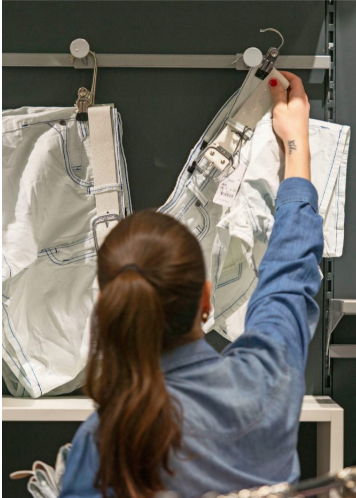
Im Detailhandel wird oft Teilzeit verlangt.

Eine aktuelle nationale Auswertung des Bundesamts für Statistik stützt diese Aussage: In