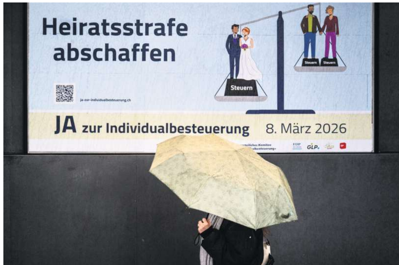
Nach dem Urnengang zur Individualbesteuerung könnten noch Abstimmungen zum gleichen Thema folgen.

Diese Haltung mag als Zwängerei erscheinen. So ist von einzelnen Mitbestimmen auch zu hören, dass bei einem klaren Volks-Ja zur Individualbesteuerung ein Rückzug der Initiative zu erwägen wäre. Ein Kernargument aus dem Mitte-Lager gegen den Rückzug: Bei der Abstimmungsvorlage zur Individualbesteuerung wie bei der Volksinitiative zur gemeinsamen Besteuerung gehe es um die Abschaffung der