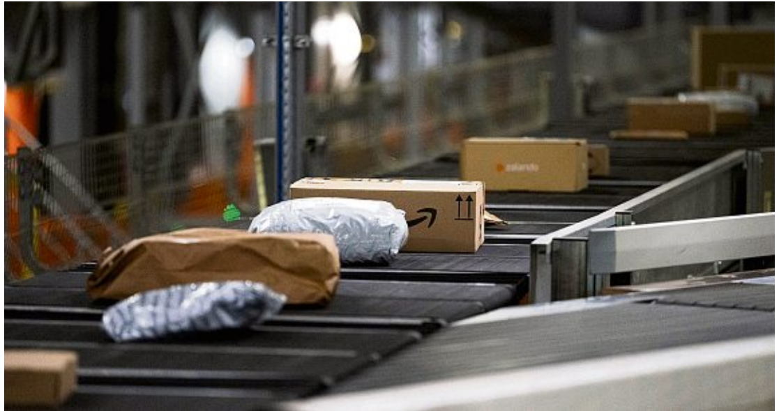
Dès ce dimanche, une taxe de 2 euros sera appliquée aux petits colis de moins de 150 euros en provenance de pays hors Union européenne, afin de freiner les importations à bas prix (image d'illustration).

Dans le budget 2026, le gouvernement décale de 14 à 18 ans l'âge