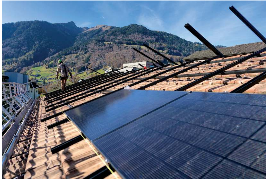
Le solaire permet de produire de l'électricité renouvelable et de renforcer l'indépendance énergétique du pays. KEYSTONE

Le solaire, y compris en milieu alpin, a le vent en poupe, même si de nombreux projets restent soumis à des procédures et oppositions. Il se développe non seulement pour produire de l'électricité renouvelable, mais aussi pour renforcer l'indépendance énergétique du pays, un thème devenu central dans le contexte géopolitique actuel, selon l'expert. Enfin, le milieu du bâtiment tire lui aussi son épingle du jeu: l'installation de pompes à chaleur et la rénovation énergétique deviennent des marchés porteurs,