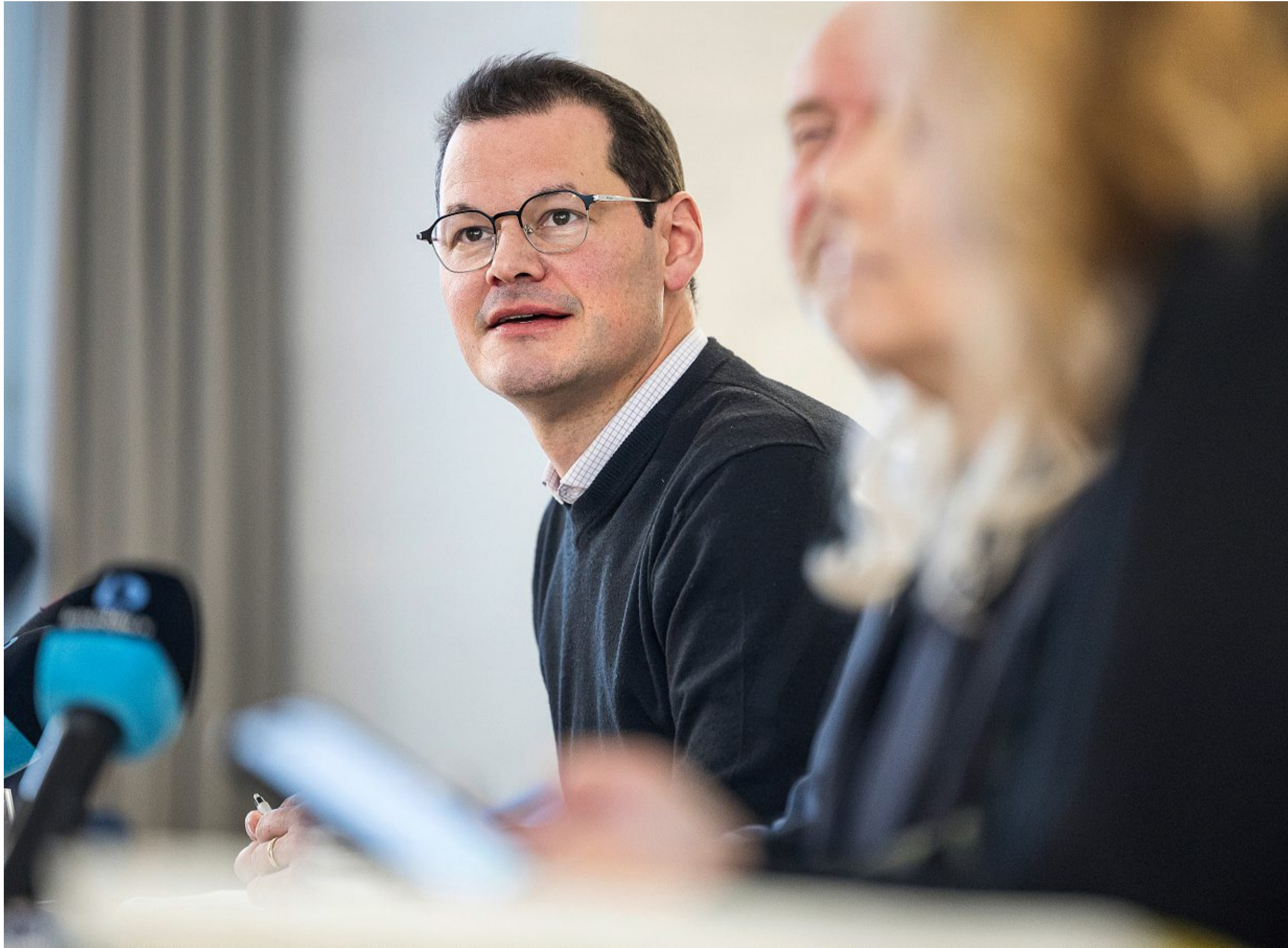
Pierre Maudet s'exprime lors d'une conférence de presse, à l'occasion des résultats des votations fédérales et cantonales du 30 novembre dernier. Pierre Albouy

— Clause du besoin et prévention: du concret salué Si la méthode du magistrat crispe,