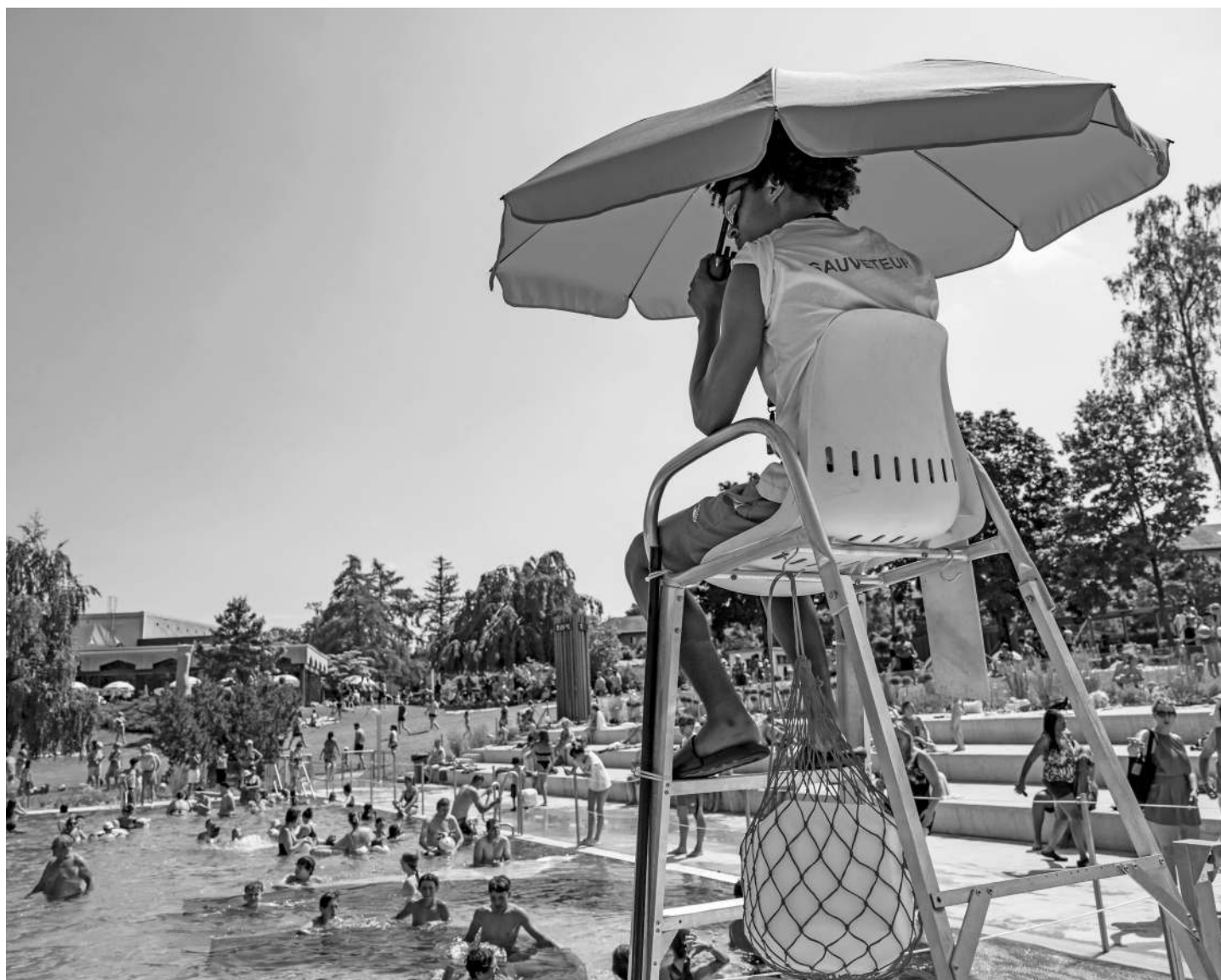
La dérogation au salaire minimum soumise au vote vise principalement les jobs d'été, période pourtant privilégiée par de nombreux·ses étudiant·es pour travailler et économiser de l'argent. PHOTO-PRÉTEXTE