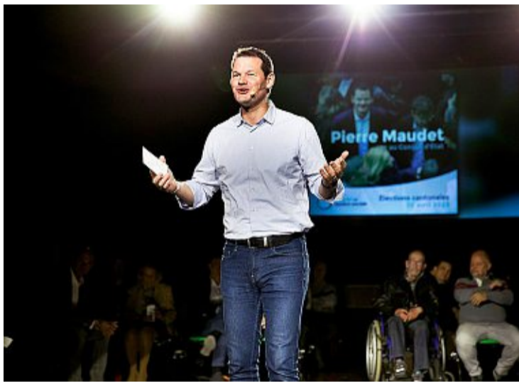
Le 20 avril 2023 au Palladium, en pleine campagne, dix jours avant la confirmation de son retour à l'Exécutif cantonal. Georges Cabrera