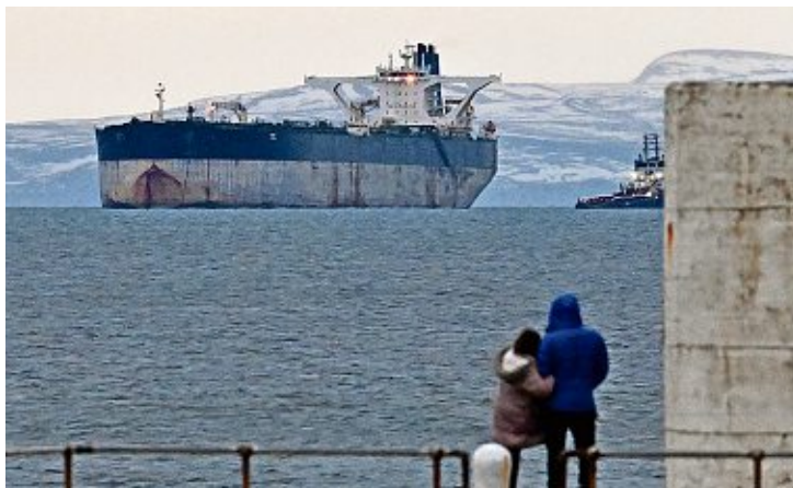
Des dizaines, voire des centaines de tankers russes errent en mer sans acheteurs pour leurs cargaisons.

Le phénomène est directement lié au durcissement récent des sanctions qui frappent le pétrole russe en particulier, à la fois au départ, en transit et à l'arrivée de son périple interlope. Depuis le 21 novembre dernier, les deux grandes compagnies russes de production