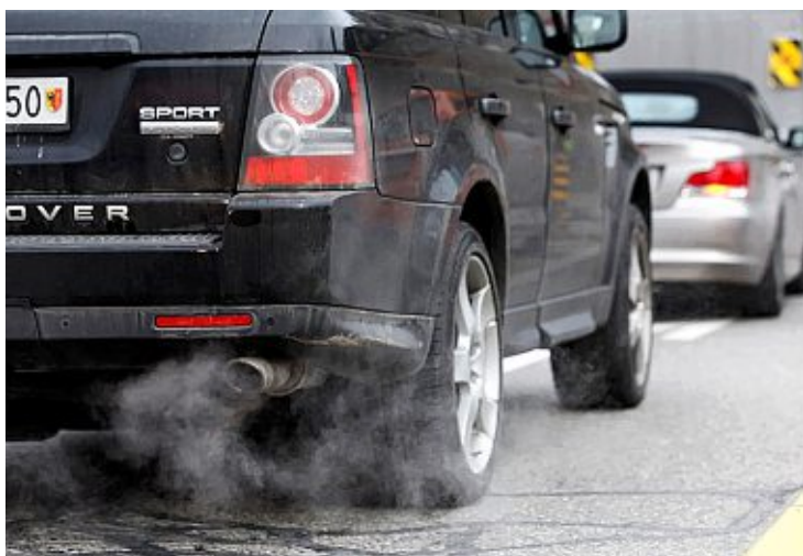
Depuis 2015, le parc s'est contracté de quelque 7000 véhicules, alors que la population a augmenté de plus de 45'000 personnes.