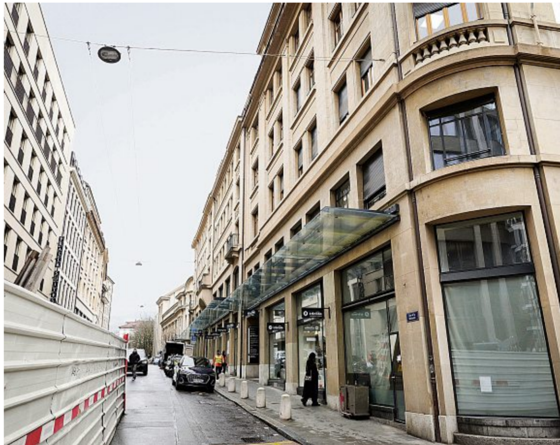
Avec nombre d'arcades déjà vides, le coin a des allures de quartier fantôme.

Selon les projections présentées par la BVK, les loyers des logements rénovés vont déjà augmenter en moyenne de 10% pendant la période de contrôle des loyers de la loi sur les démolitions, transformations et rénovations de maisons d'habitation (LDTR). Une fois cette période achevée, quel sera le rendement visé à terme pour quels niveaux de loyers? Interpellé, le propriétaire précise «ne pas donner généralement d'information sur le rendement de ses investissements».