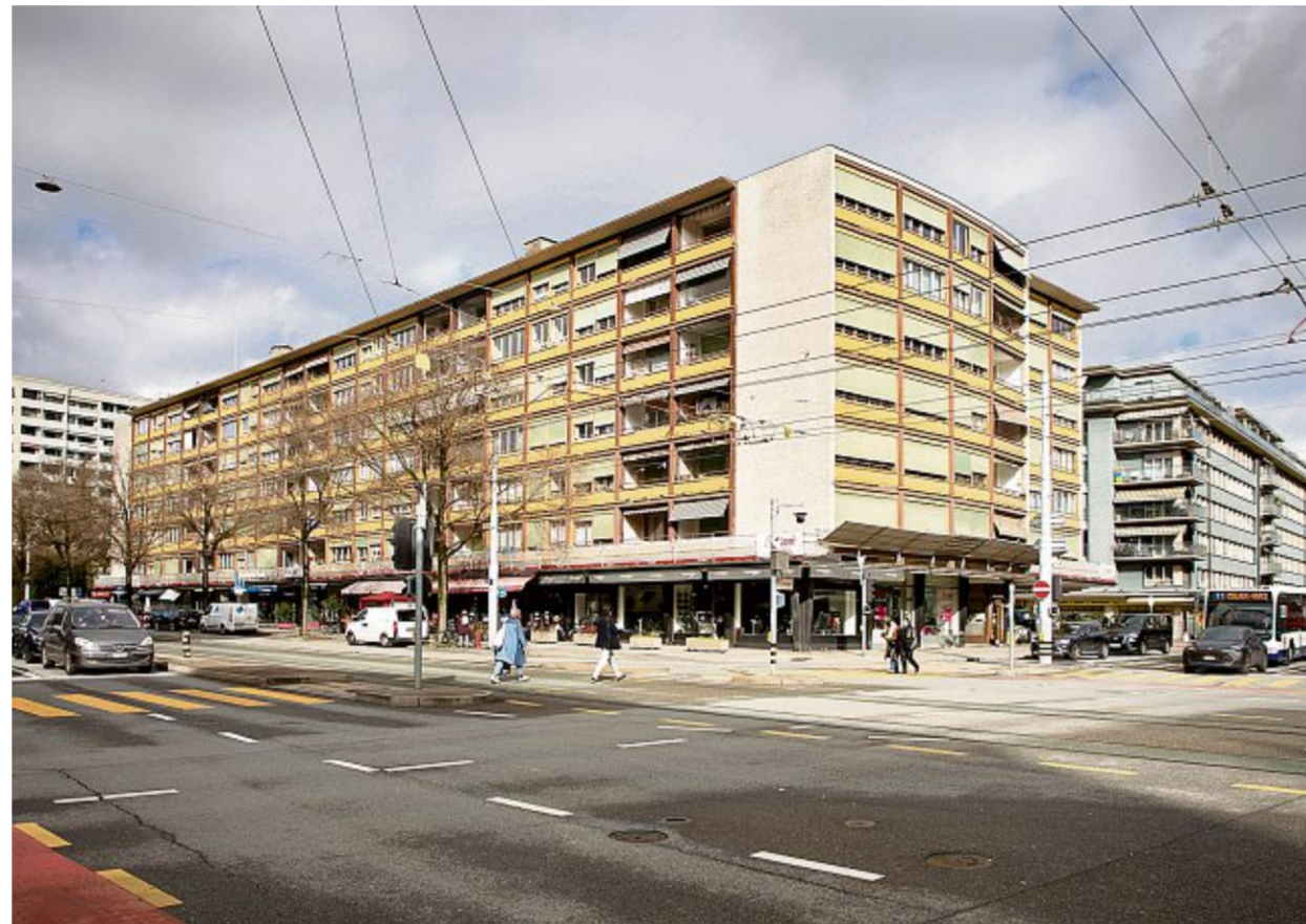
À l'angle de la rue Hoffmann et de la route de Meyrin, le bâtiment est concerné par des résiliations massives.

Pour les habitants, c'est l'angoisse. Dans un canton où le taux de vacances est le plus bas du pays, à 0,34% – ce qui signifie que seuls 3,4 logements sur 1000 sont libres –, les opportunités de se reloger sont rares. Et à quel prix? Au 13, rue Butini, l'immeuble compte sept studios et seize cinq-pièces. Pour ces derniers, les prix varient entre 1900 francs, pour les plus anciens locataires, et 3000 francs pour les baux les plus récents. «Je cherche, je cherche mais je ne trouve rien, ou trop cher, relate un autre habitant. On se sent complètement abandonné par la régie et par les autorités.»