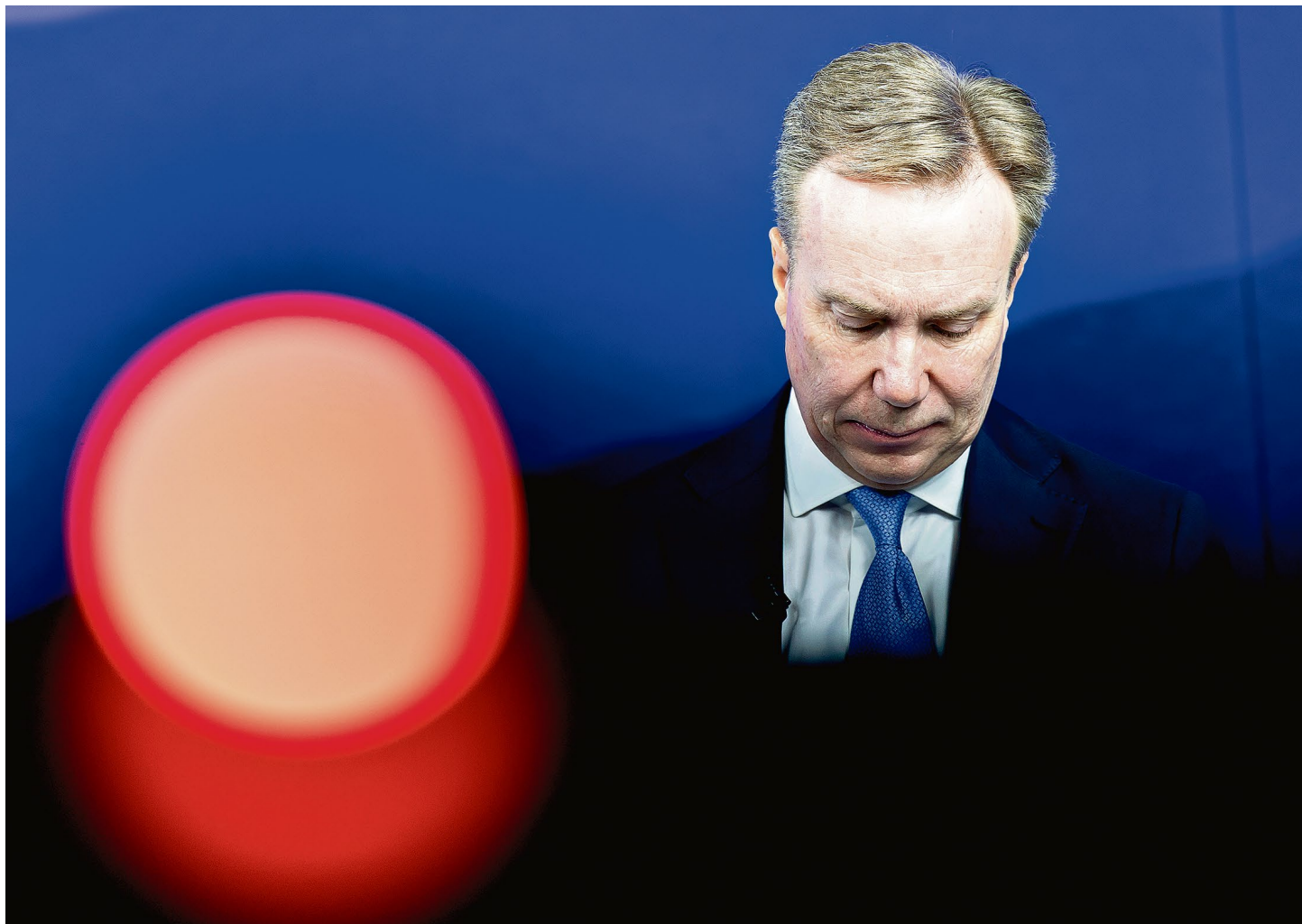
Børge Brende: «Je pense que le moment est venu pour le Forum de poursuivre son important travail sans distraction.»