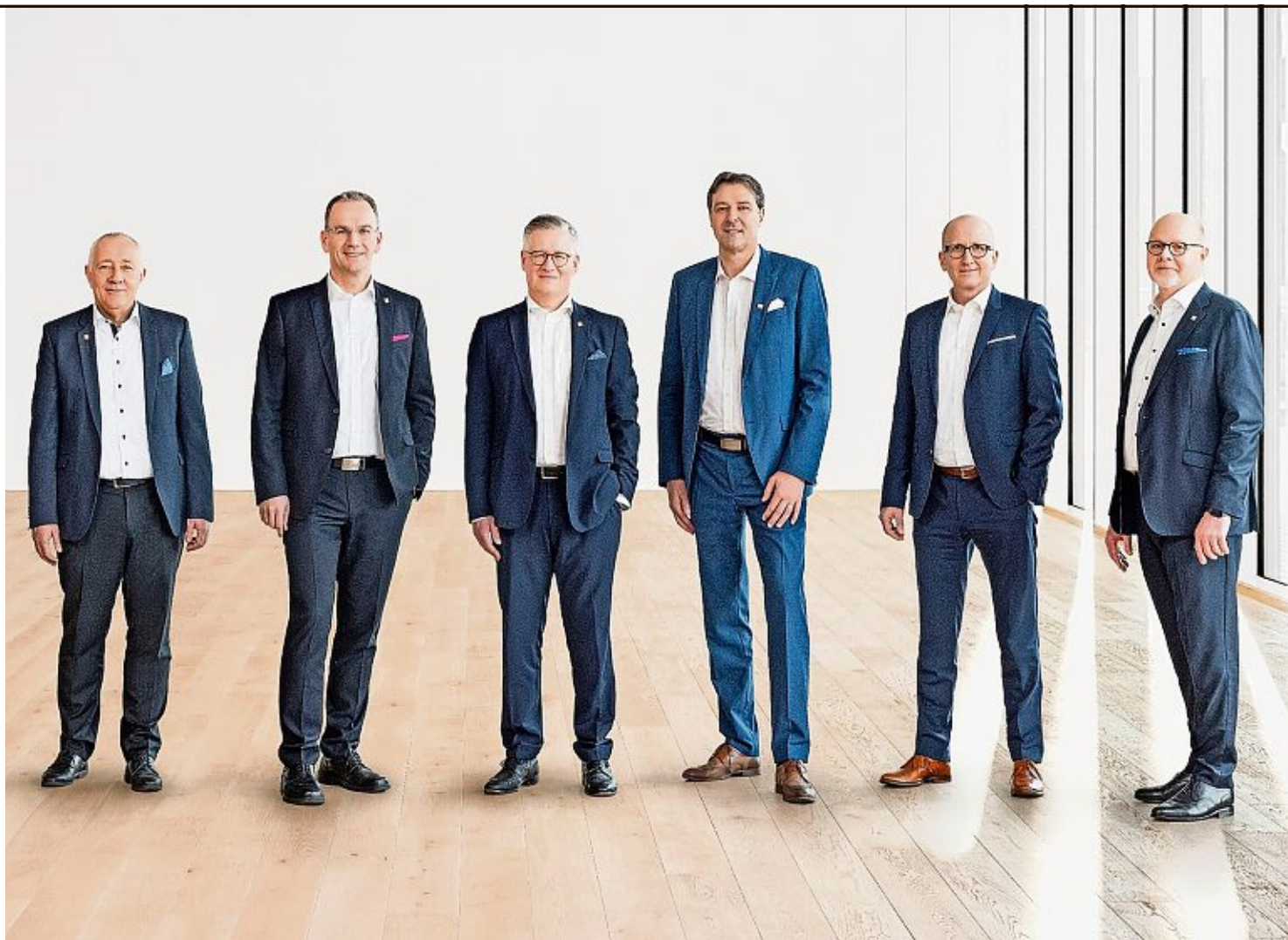
Allesamt männlich und mindestens 55 Jahre alt: Die Geschäftsleitung der Baselbieter Firma Endress + Hauser.