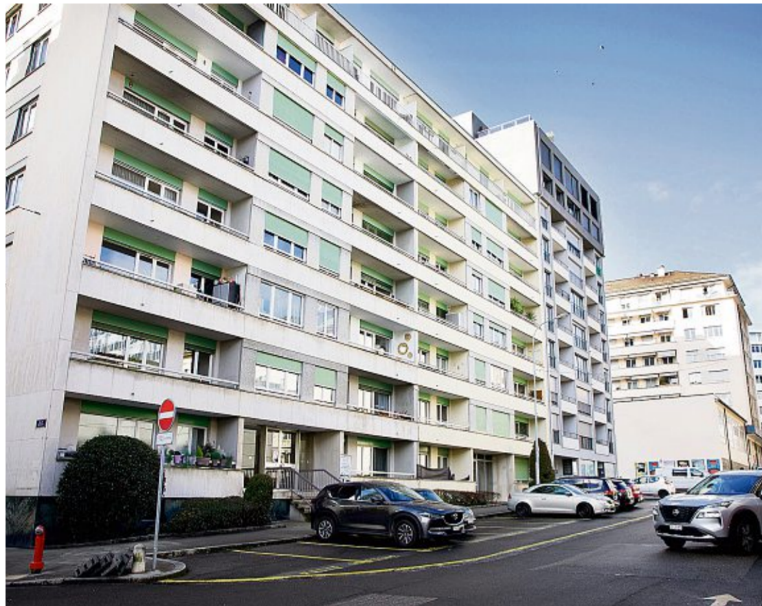
Les locataires du 13, rue Butini ont vu leur bail résilié en décembre dernier.