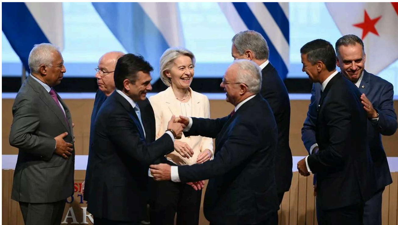
Les dirigeants du Mercosur avec la présidente de la Commission européenne, Ursula von der Leyen, lors de la signature officielle de l'accord commercial entre l'Amérique du Sud et l'UE, le 17 janvier.

Après la ratification par l'Uruguay et l'Argentine, la présidente de la Commission a pris ce geste fort sans attendre le verdict de la justice européenne et le consentement des eurodéputés.