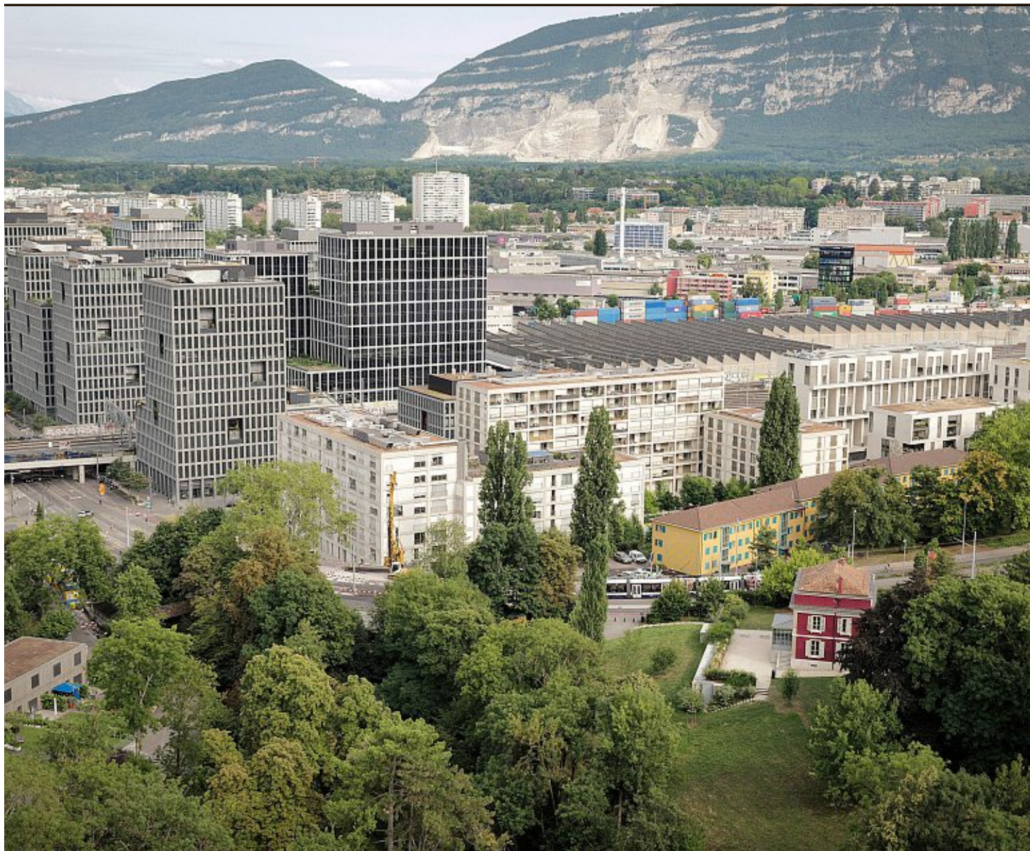
Les futures tours concernées vont largement dépasser celles de Pont-Rouge et changer la «skyline» du canton. Laurent Guiraud