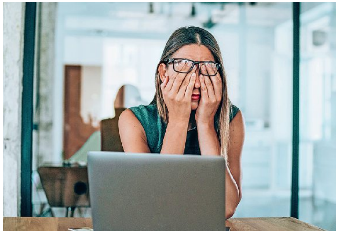
Instaurer un congé pour rupture amoureuse en Suisse reste difficile à envisager.

Le spécialiste rappelle que le Code des obligations «précise un certain nombre de congés usuels pour un mariage, une adoption, la maladie ou le décès d'un proche». Il relève aussi que l'Espagne s'est dotée d'un congé menstruel en 2023, tout comme la Ville d'Yverdon en 2024. «Il y a une tendance progressiste parce que les employeurs ont compris qu'ils ont intérêt à veiller aux besoins de leurs employés. S'il existe un congé pour le mariage,