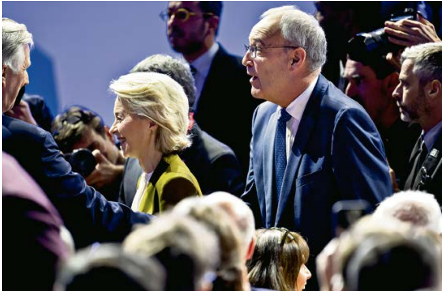
Ursula von der Leyen et Guy Parmelin au Forum économique mondial, le 20 janvier 2026 à Davos.