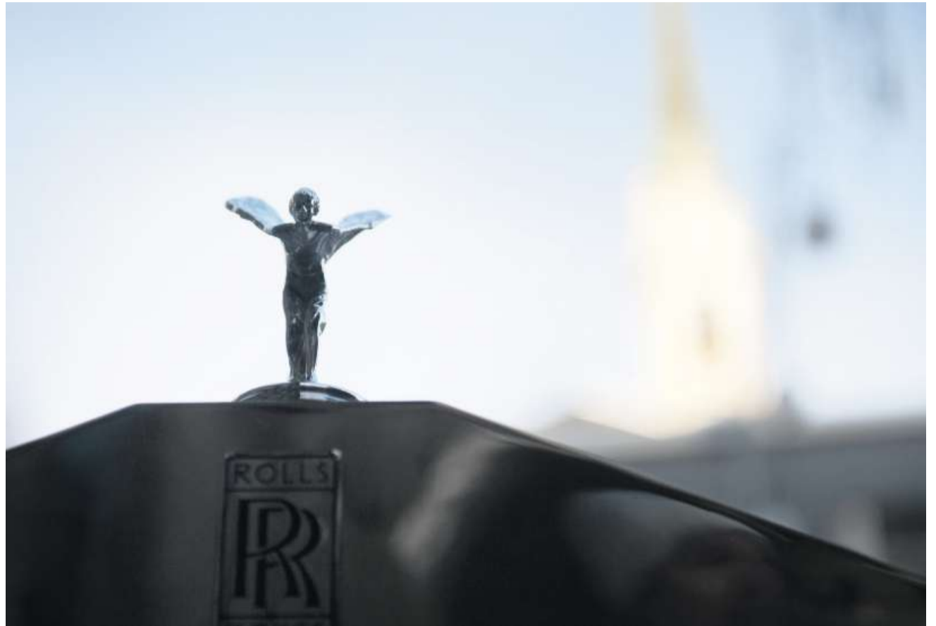
Die Vermögen haben sich in der Schweiz in den letzten 25 Jahren mehr als verdoppelt.

Laut der Studie gibt es jedoch noch einen weiteren Grund: Die Steuern auf Vermögen und Erbschaften sind gesunken. So sank der durchschnittliche Vermögenssteuersatz von 0,35 im Jahr