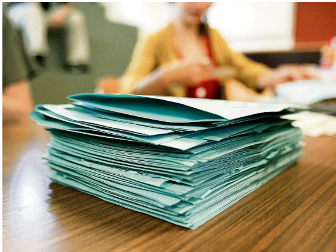
La Cour de justice genevoise devra statuer sur ces nouvelles réquisitions.

Dans un arrêt daté du 11 février, le TF estime que la Chambre constitutionnelle de la Cour de justice aurait dû tenir compte de la réplique du recourant, écartée au motif qu'elle avait été déposée hors délai. Or, selon le Tribunal fédéral, celle-ci avait bien été envoyée par La Poste le dernier jour du délai fixé par la Cour.