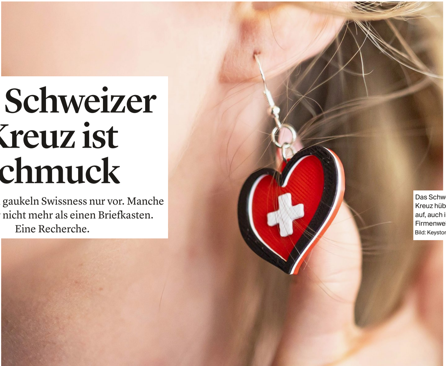
Das Schweizer Kreuz hübscht auf, auch in der Firmenwelt.

Viele Firmen gaukeln Swissness nur vor. Manche haben hier nicht mehr als einen Briefkasten. Eine Recherche.