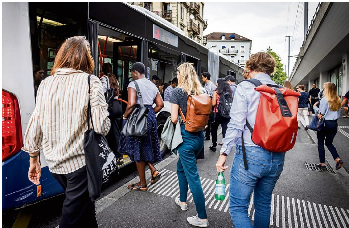
Des voyageurs montant à bord du bus F, à la gare Cornavin. Magali Girardin

Dans le détail, on note que la catégorie d'âge ayant le plus bénéficié de l'offre d'un abonnement annuel est celle des enfants de 6 à 17 ans. Chez ceux-ci, 86% des personnes en ont un, soit 62'221 enfants. L'offre est encore plus populaire auprès des 18-24 ans en formation à Genève et résidant hors du canton: ils sont 89% à détenir