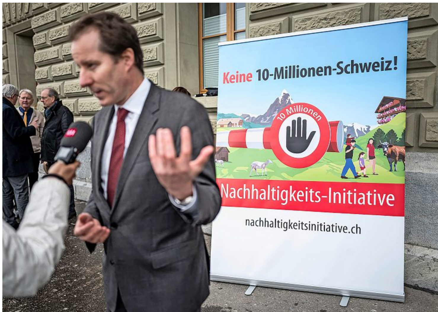
Nachhaltigkeitsinitiative: SVP-Nationalrat Thomas Aeschi im April 2024 bei der Übergabe der Unterschriften vor dem Bundeshaus.

Auch die «Welt» hat einen Bericht veröffentlicht, dessen Kommentarbereich aufschlussreich ist. Die Leser des rechtsbürgerlichen Mediums begrüssen die Initiative. Kommentare wie