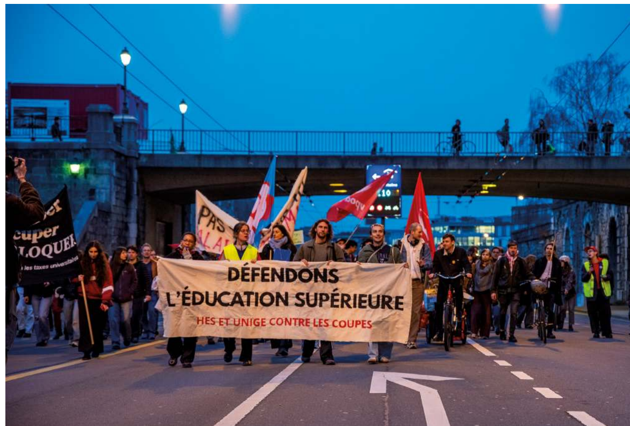
Le cortège s'est rendu en vieille-ville, en passant non loin du bâtiment du DIP, avant de marquer une halte devant les bureaux du PLR. JEAN-MICHEL ETHEMAÏTÉ

Le message des manifestant·es est clair et se veut entendu jusqu'à Berne. Alors que l'augmentation des taxes d'études instaurée lors de la rentrée 2025 dans les hautes écoles – de 40% pour les étudiant·es suisses et de 110% pour les étudiant·es étrangères – sont toujours décriées, il en est désormais de même pour les mesures prévues dans le programme d'allègement budgétaire 2027 de la Confédération, rédigé par le Conseil fédéral et actuellement en discussion au parlement. Le document table sur des économies de 460 millions en lien avec l'enseignement supérieur. Les Chambres se sont montrées plus généreuses que les Sept Sages et proposent désormais des coupes réduites, mais pas de quoi apaiser Geneviève Preti, du Cartel intersyndical du personnel de la fonction publique, et des milieux subventionnés. Elle invite à «se battre pied à pied» contre l'austérité. Florine et Annie ont fait le déplacement