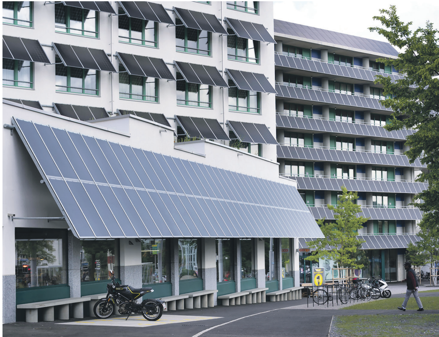
Indépendance. La Suisse pourrait largement couvrir elle-même ses besoins énergétiques d'ici à 2050. Mais le pays n'a que légèrement gagné en autonomie depuis le début du conflit russo-ukrainien.

Auteur principal d'une étude démontrant que la Suisse pourrait largement couvrir elle-même ses besoins en énergie d'ici à 2050, Jonas Schnidrig évoque un contre-balancement en fonction de l'intérêt économique: «Si les importations continuent de coûter cher en raison des conflits géopolitiques, le modèle d'affaires actuel basé sur des coûts courants faibles grâce à des importations bon marché pourrait basculer vers des investissements plus élevés en Suisse, avec en contrepartie des coûts d'exploitation