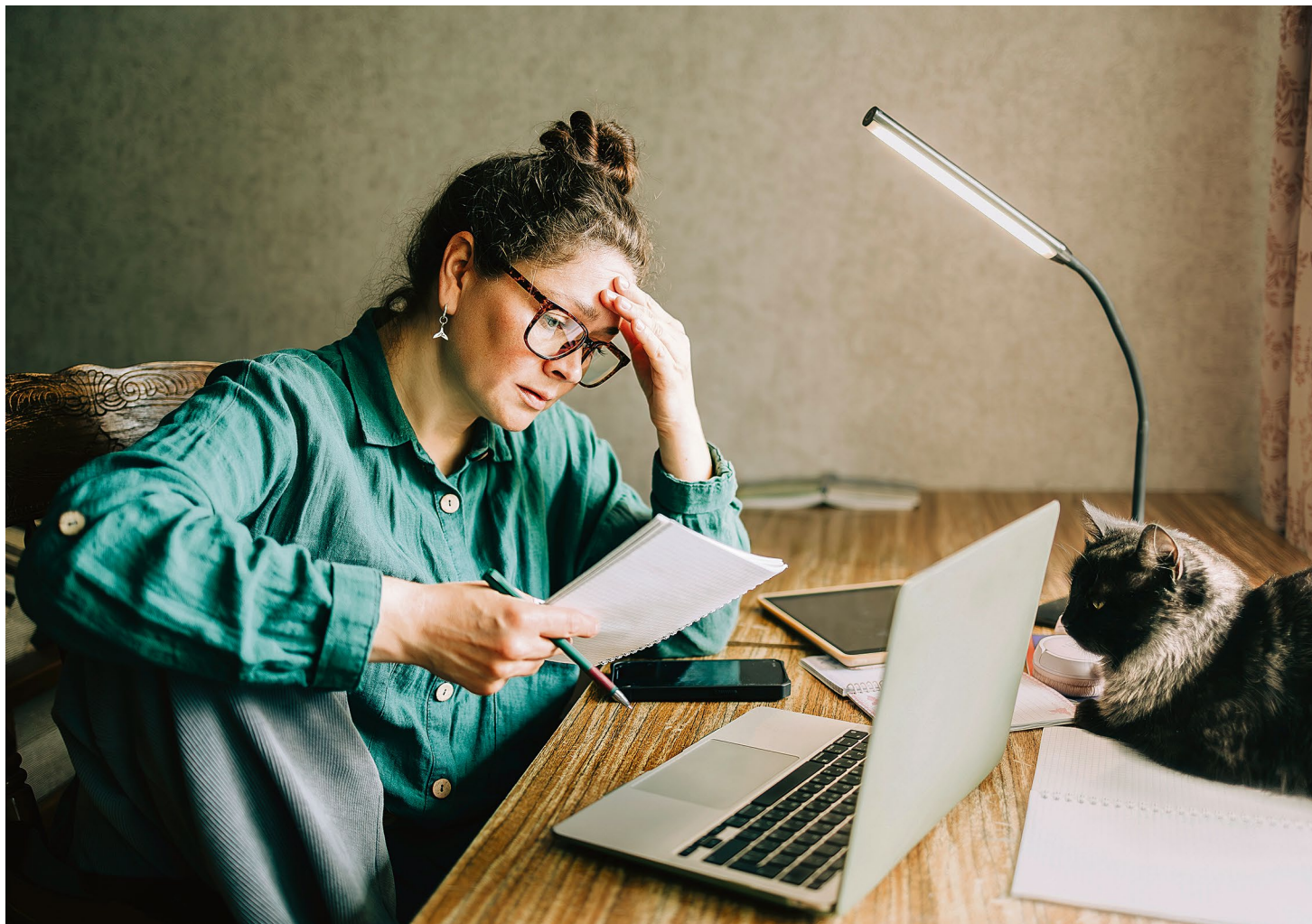
La possibilité du travail à domicile «prescrit» par le médecin est apparue en Suisse lors de la pandémie.