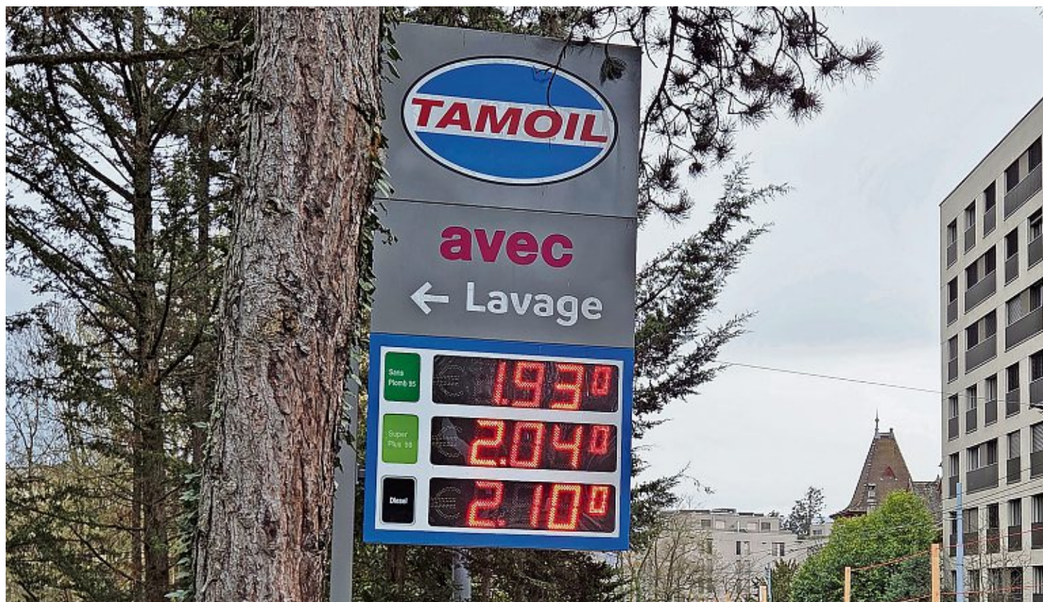
Trafics des carburants, ce mardi, dans une station-service du quartier du Petit-Saconnex à Genève. «Si les fluctuations se poursuivent, les prix à la pompe pourraient rester instables pendant plusieurs semaines, voire plusieurs mois», prévient le TCS. PA Sallier

Ce n'est pas terminé. «En règle générale, les variations du prix du pétrole brut se répercutent sur les prix dans les stations-ser-