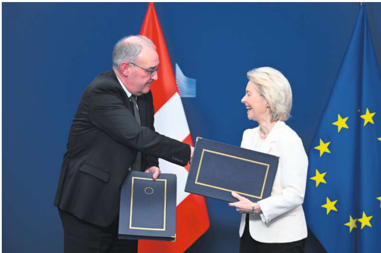
Bundespräsident Guy Parmelin und die Präsidentin der EU-Kommission, Ursula von der Leyen, am 2. März.

Swiss Economics hat die Ecoplan-Zahlen analysiert. Dabei zeigt sich: Der prognostizierte BIP-Rückgang von 4,9 Prozent basiert primär auf der Annahme, dass bei einem Wegfall der Bilateralen I – und somit auch der Personenfreizügigkeit – bis 2045 rund 340 000