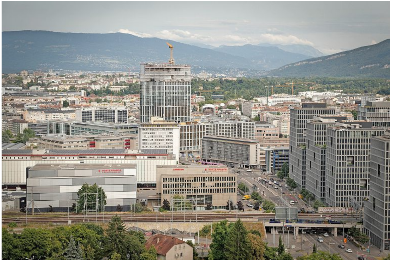
Le quartier de l'Étoile, en août 2025. On y voit la construction de la tour Pictet. Des tours beaucoup plus hautes pourraient y pousser et dessiner une nouvelle centralité de Genève.

Liliane Roskopf, membre de l'association pétitionnaire, voit