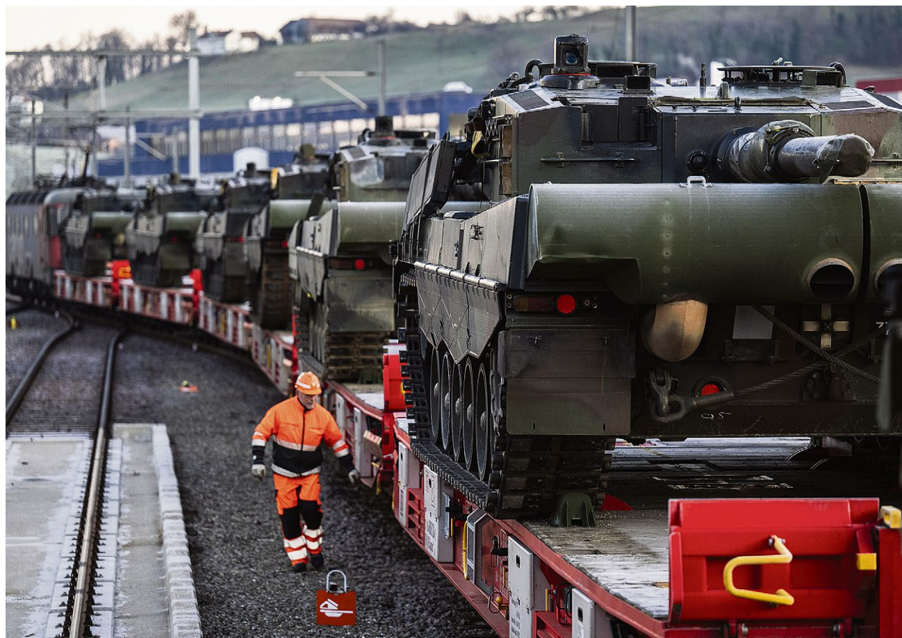
Des chars Leopard de l'armée suisse décommissionnés en partance pour l'Allemagne. Le projet élaboré par le parlement devrait permettre aux entreprises helvétiques de livrer du matériel de guerre à 25 pays occidentaux impliqués dans un conflit armé. (30 JANVIER 2024/GIAN EHRENZELLER/KEYSTONE)

«L'assouplissement de la loi a été adopté sur deux arguments: l'idée qu'il fallait soutenir une industrie de l'armement en difficulté et les pressions de l'Allemagne, qui menaçait de ne plus se fournir en Suisse en raison des restrictions d'exportation. Cette augmentation et la place de l'Allemagne montrent que cette modification de la loi n'était pas nécessaire, estime Fabien Fivaz, conseiller aux Etats (Les Vert-e-s/NE). Le texte est certes contrai-