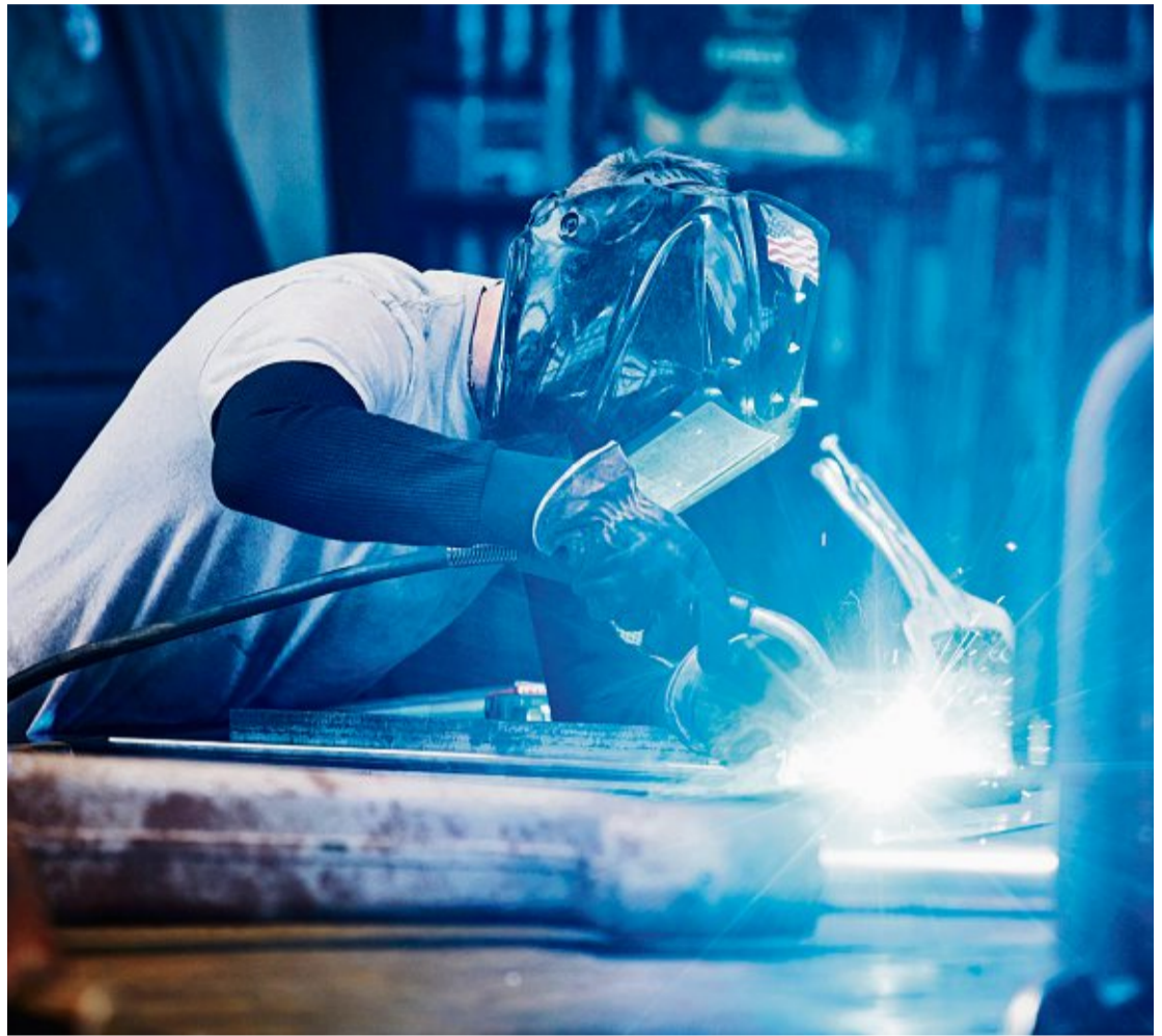
Lohnempfänger werden immer stärker zur Kasse gebeten.

Laut den Autoren drohen einer durchschnittlichen Arbeitnehmerin höhere Lohnabzüge von über 2200 Franken im Jahr. Sie gehen in ihrer Modellrechnung davon aus, dass unter anderem die 13. AHV-Rente ausschliesslich mittels Lohnabgaben finanziert wird. Sie rechnen zudem damit, dass die Initiativen zur Abschaffung des Ehepaarplafonds (der Mitte) und zur Einföhrung einer