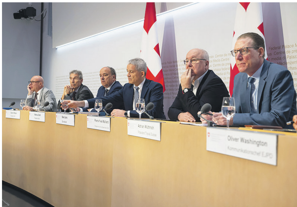
UE. Les 13 mesures dites «d'accompagnement» à la libre circulation des personnes adoptées en mars 2025 par les partenaires sociaux sont la traduction la plus visible du rapport de force avec le patronat.

Sans leur soutien, une adoption de ces traités, combattus par l'UDC, serait quasiment vouée à l'échec. Dès lors, les représentants des travailleurs font avancer leurs prérogatives face à l'Union patronale suisse (UPS) et l'Union suisse des arts et métiers (Usam), dont les membres doivent recruter du personnel étranger dans un contexte de pénurie de main-d'œuvre. Sans la libre circulation, les entreprises continueraient certes d'engager des Allemands ou des Français, mais elles seraient vraisemblablement