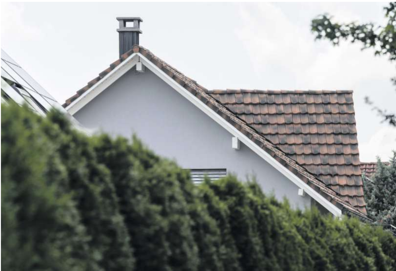
Ein Haus nur für sich und seine Familie – und dann noch mit Umschwung – bleibt in Zukunft vielen versagt.

Der Traum vom eigenen Garten schwindet – mit der Verdichtung werden Mehrfamilienhäuser zur Norm