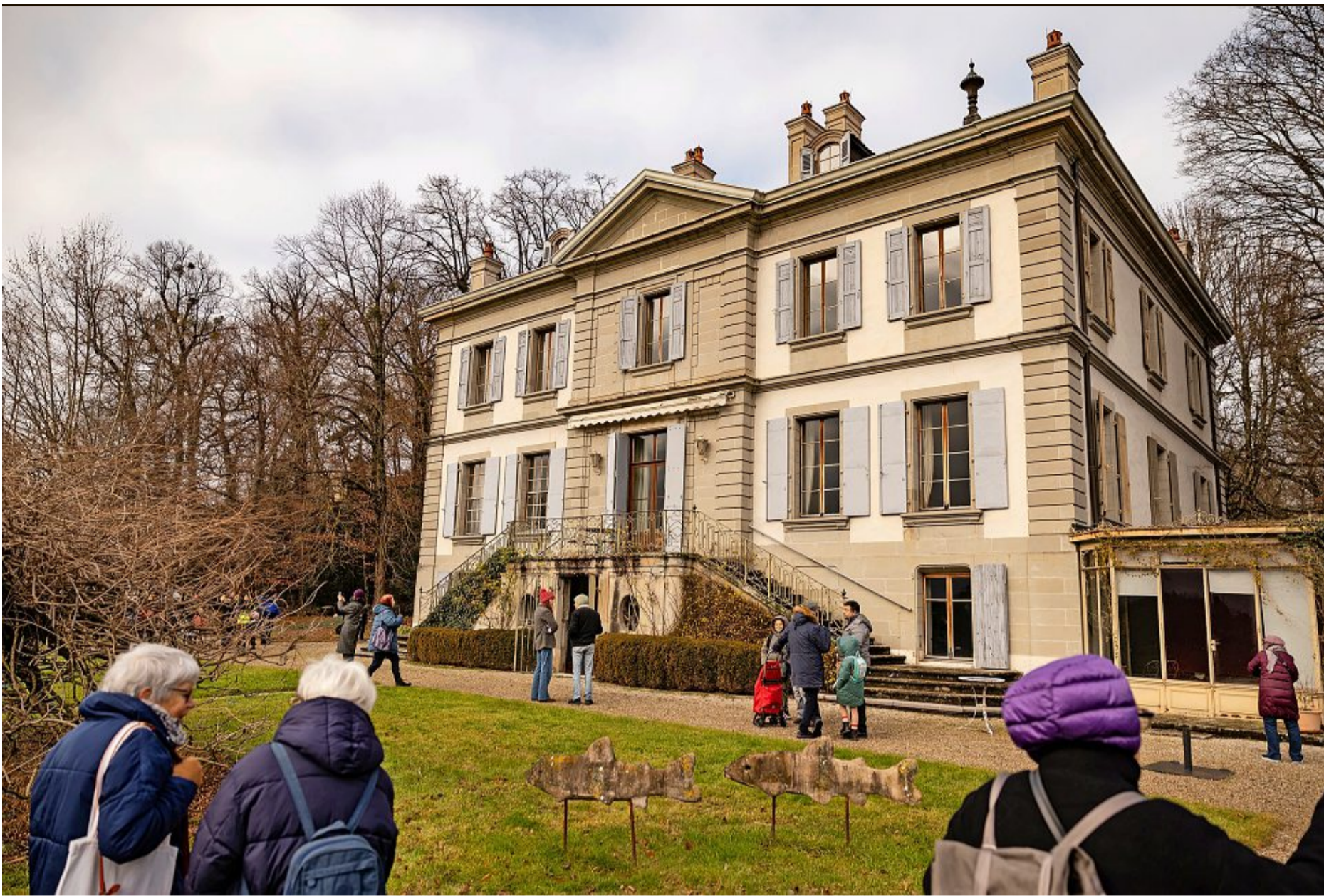
Le terrain de 35'000 m 2 est agrémenté d'une villa de maître datant du XVIII e siècle, à l'avenue d'Aire, dans le secteur Charmilles-Concorde.