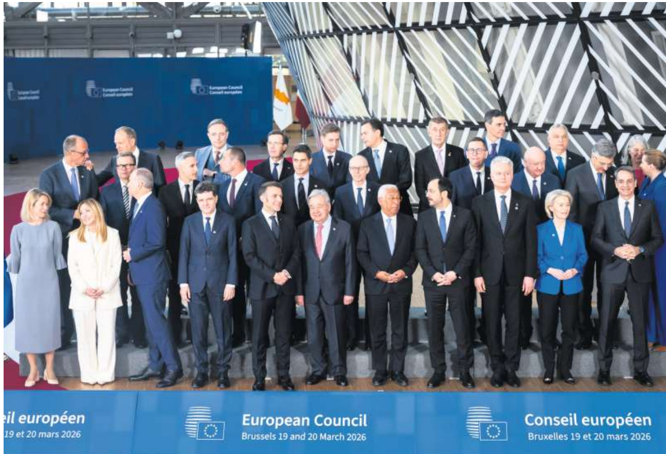
Die Regierungschefs der EU-Länder haben sich am Donnerstag in Brüssel getroffen, um über die anziehenden Treibstoffpreise zu diskutieren. Doch nicht alle Mitgliedstaaten sind davon gleichermassen betroffen.

Kein Wunder, haben sich einige EU-Mitgliedsländer auf das Emissionshandelssystem eingeschossen, unter ihnen Polen, Italien, Tschechien, die Slowakei oder Belgien. Sie möchten für die heimische Industrie gerne Erleichterungen herausholen. «Ich bin hier, um für