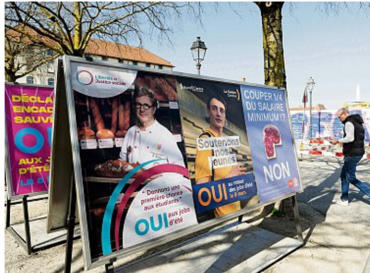
La population se prononçait notamment sur la proposition de rémunérer 25% moins cher les jobs étudiants durant l'été. Laurent Guiraud

Avec l'âge, le phénomène s'inverse: chez les seniors, ce sont les hommes qui se rendent davantage aux urnes, ajoute-t-il: «Il y a plus de veuves que de veufs. Or le veuvage conduit souvent à l'absentéisme, car il est corrélé à un isolement social et à une intégration moins forte. À cela s'ajoutent les effets de l'introduction tardive du droit de vote des femmes en Suisse: les femmes très âgées n'ont pas été socialisées politiquement de la même manière. Il existe aussi un effet culturel, certaines votaient avec leur mari et cessent de le faire après sa disparition.»