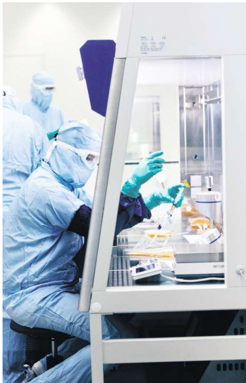
Angestellte von Novartis arbeiten im Werk in Stein an Zelltherapien. Ihr Bereich ist von der im November angekündigten Restrukturierung nicht betroffen.

Während der Pandemie gehörte die Pharmabranche noch zu den Gewinnern. Viele Medikamentenhersteller erhöhten ihren Personaletat in der Erwartung, dass die Gesundheitsbudgets auf lange Sicht steigen würden. Mit dem