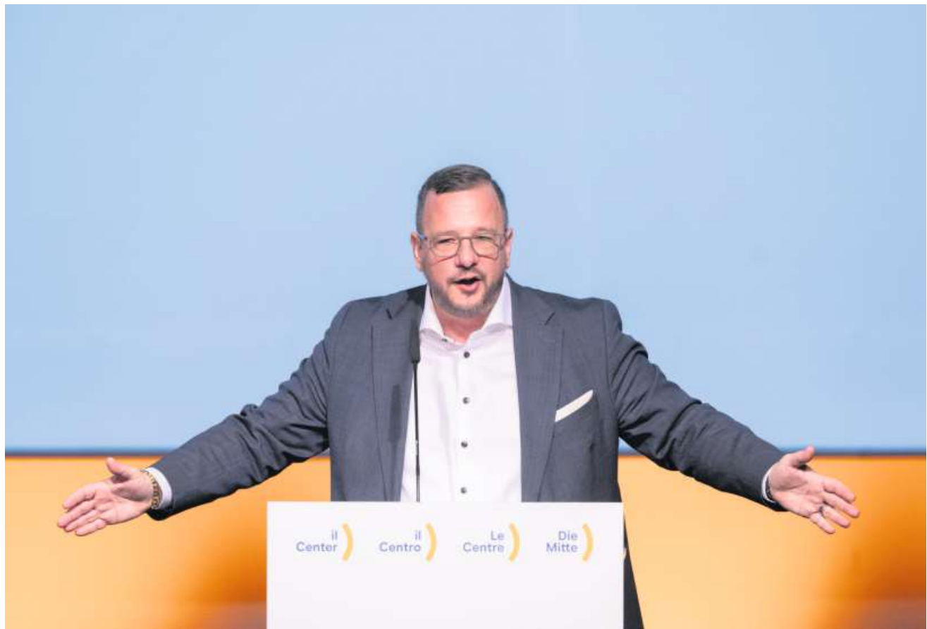
Der Mitte-Präsident Philipp Matthias Bregy riskiert ein zweites Kräfteressen mit den Liberalen und Linken.

Daraus wird nun nichts. Zwar obliegt es formell dem Initiativkomitee, über einen allfälligen Rückzug zu entscheiden. Doch nach Bregys klarer Ansage wäre ein solcher Schritt nicht nur erstaunlich, sondern auch peinlich. Somit ist davon auszugehen, dass die Volksabstimmung über die Mitte-Initiative im November 2026 oder im Februar 2027 stattfindet. Wird sie abgelehnt, ist der Fall klar: Der jahrzehntelange Zwist um die «Heiratsstrafe» wäre damit definitiv beigelegt. Der Umsetzung der Individualbesteuerung in den Kantonen, die bis im Jahr 2032 erfolgen soll, stünde nichts mehr im Wege.