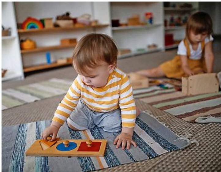
En 2025, 12'411 enfants ont été accueillis dans une structure du canton, (image prétexte).

À l'inverse, les jardins d'enfants affichent une grande stabilité. En 2025, 94 structures sont recensées dans le canton. Elles totalisent 2021 places et accueillent 2897 enfants. Ces chiffres sont restés globalement inchangés au cours de la dernière décennie.