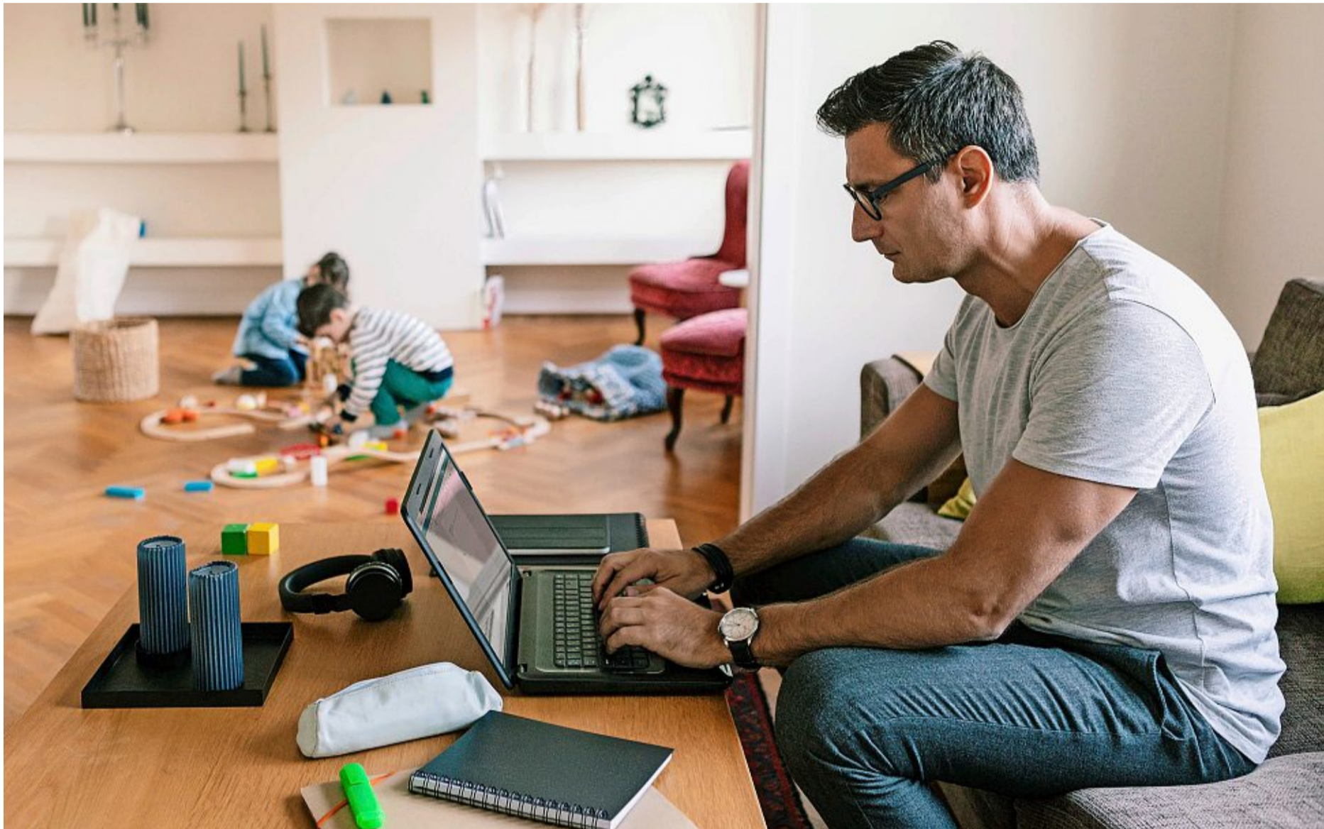
Homeoffice ist bei Vätern und Müttern beliebt, weil sich Arbeit und Kinderbetreuung ohne Pendeln einfacher koordinieren lassen.

Homeoffice Unternehmen schränken die Möglichkeit zunehmend ein oder schaffen sie ganz ab. Der Kurswechsel belastet berufstätige Eltern und könnte sich für Arbeitgeber als Bumerang erweisen.