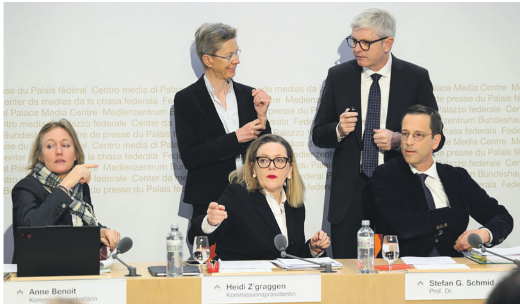
Transparence. Le 27 mars, la commission des institutions politiques de la Chambre haute a décidé de tenir en public son audition de cinq spécialistes de la double majorité.

Les sénateurs s'empareront en priorité du dossier en septembre. Les débats se poursuivront au National, potentiellement jusqu'en 2028. A Bruxelles, le tempo est tout autre. Mercredi dernier, le président de la Commission du commerce international du Parlement européen, Bernd