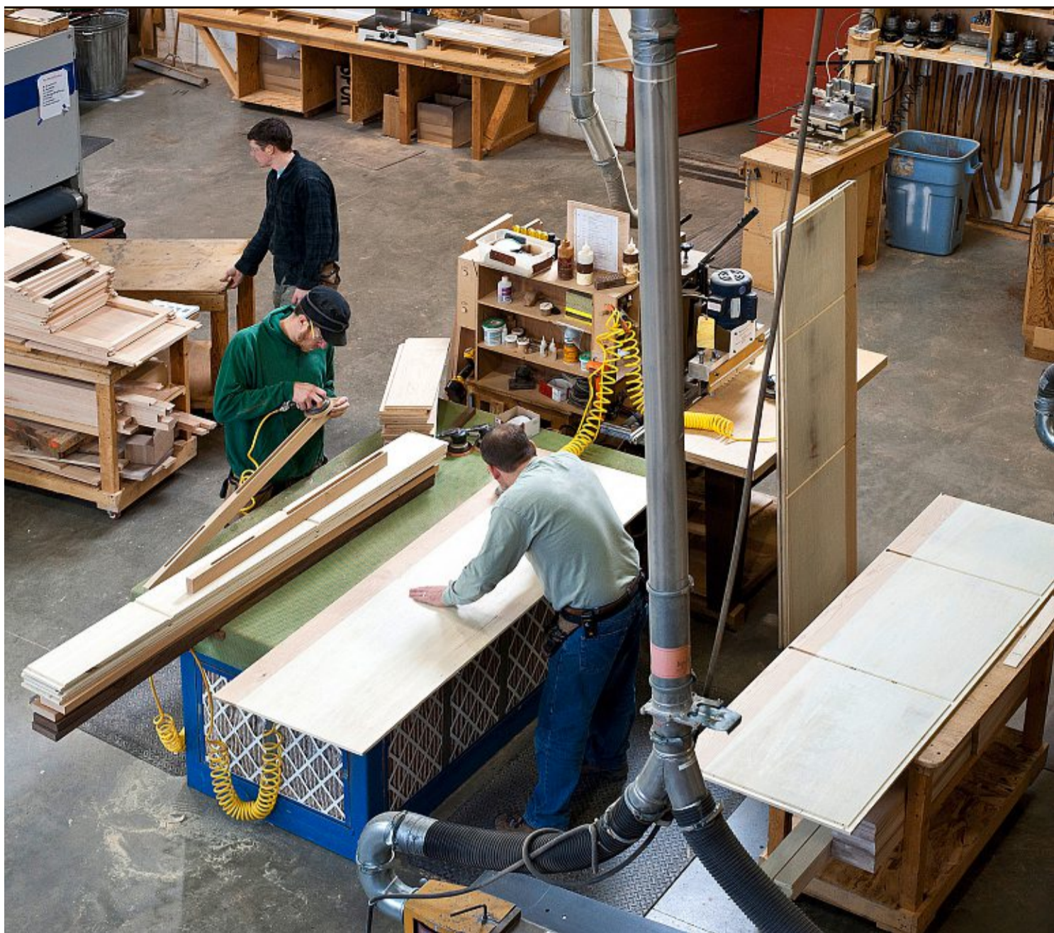
L'artisanat est considéré comme une valeur sûre. Or, là aussi, les postes vacants sont en recul.