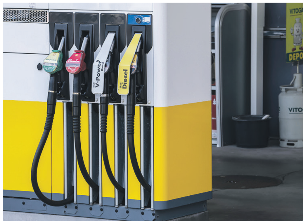
Prix. La remontée des prix spot (au jour le jour) du pétrole a entraîné une hausse de ceux à la pompe, y compris aux Etats-Unis.

A court terme, le choc inflationniste devrait l'emporter sur la perte de croissance liée au conflit, laquelle devrait