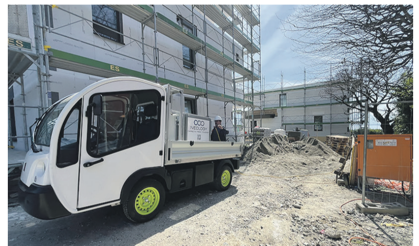
Energie. Neology a mis au point une méthode pour convertir l'ammoniac en hydrogène, ce dernier élément pouvant à son tour être utilisé pour produire de l'électricité.