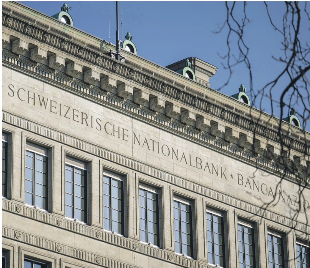
Berne. La future répartition des bénéfices se discute actuellement, la BNS et le Département fédéral des finances négociant une nouvelle convention pour la période 2026-2030.

«Les versements seraient beaucoup moins volatils qu'aujourd'hui, puisqu'ils ne fluctueraient qu'en fonction de l'évolution du total des actifs de la BNS», explique le groupe de réflexion composé de trois économistes. En outre, leur montant pourrait être en moyenne plus élevé qu'aujourd'hui, «car la distribution des bénéfices deviendrait la priorité» alors que la pratique actuelle vise à accroître les provisions chaque année. La distribution interviendrait donc chaque année, mais sans risque pour la BNS si le pourcentage retenu n'est pas élevé, précise l'Observatoire. En appliquant un taux de