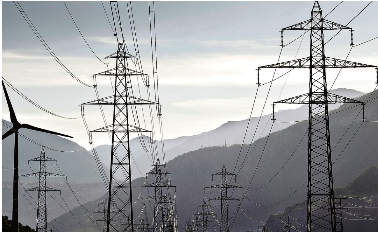
Des pylons électriques à Dorénaz, à l'entrée du Valais, le 7 novembre 2024.

Les conséquences pour la Suisse sont déjà visibles: multiplication et intensification des événements extrêmes, vagues de chaleur plus fréquentes et intenses, périodes de sécheresse prolongées et fortes précipitations. En montagne, la fonte des glaciers et la diminution de l'enneigement s'observent. Des risques éco-