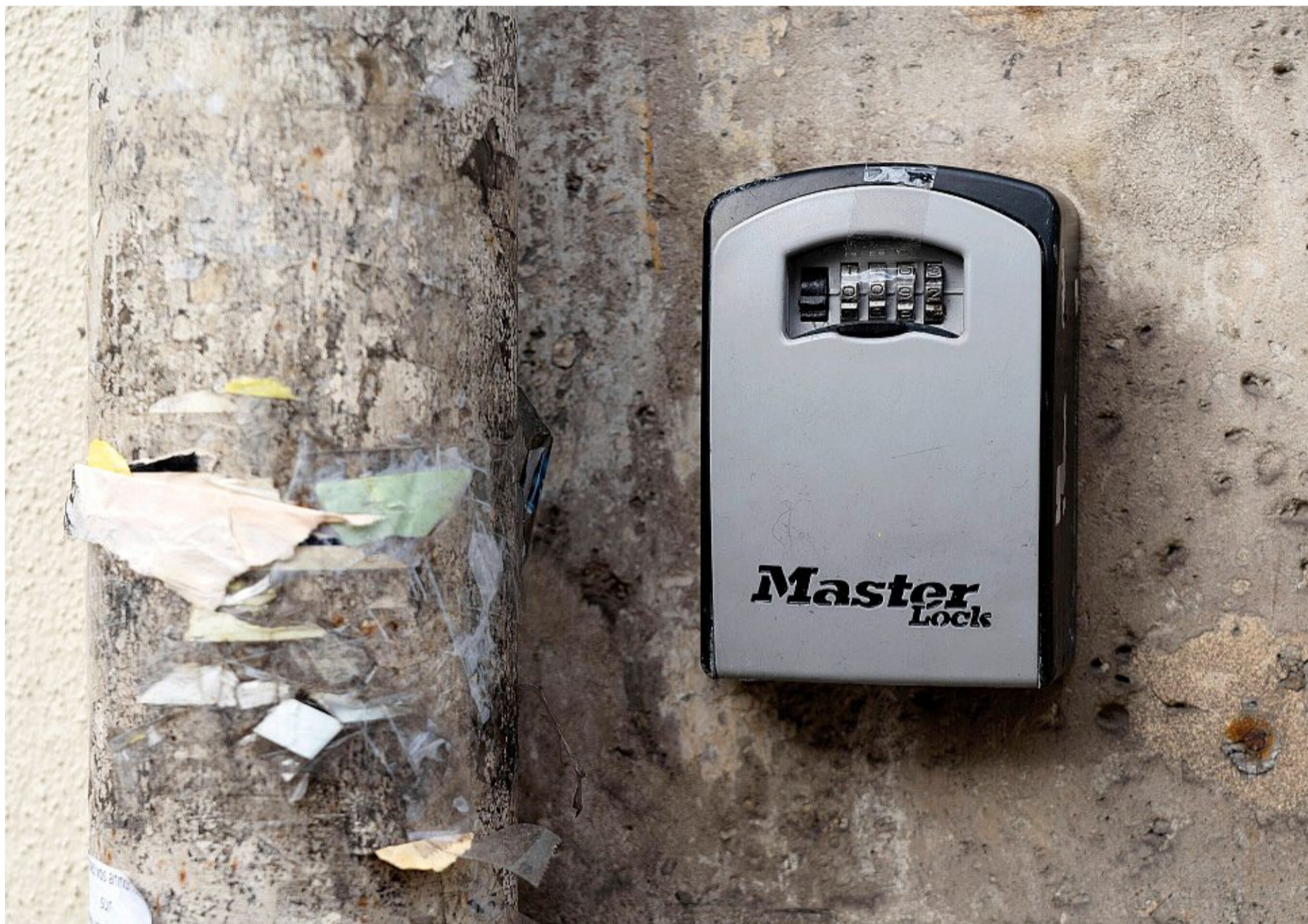
Genève, à l'instar d'autres centres urbains, veut renforcer la lutte contre la location abusive d'appartements via les plateformes.

Ce projet mûrit alors que des élus au Grand Conseil ont pointé plusieurs fois, ces dernières années, des lacunes dans le contrôle de ce marché, et réclamé un durcissement de la loi.