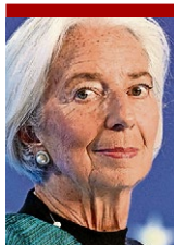
CHRISTINE LAGARDE PRÉSIDENTE DE LA BANQUE CENTRALE EUROPÉENNE

Les grandes manœuvres pour prendre la succession de Christine Lagarde ont commencé. En faisant opportunément fuiter dans la presse, mi-février, qu'elle n'excluait pas de partir avant la fin de son mandat, prévu normalement fin octobre 2027, la présidente de la Banque centrale européenne (BCE) a forcé les candidats à se découvrir, et les Etats de la zone euro, à commencer leur jeu de lobbying.