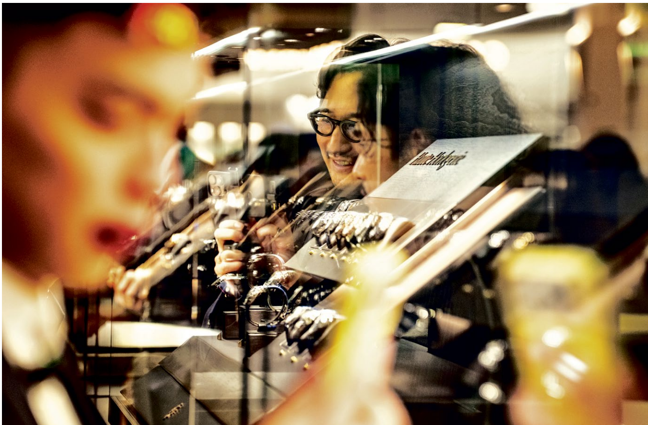
Une foule des grands jours s'est pressée au Watches and Wonders. (PALEXPO, GENÈVE, 14 AVRIL 2026/DAVID WAGNIÈRES/LE TEMPS)

HORLOGERIE La fréquentation a été une nouvelle fois record, signe de l'intérêt grandissant pour la culture portée par les marques. Les chiffres finaux de Watches and Wonders confirment le passage de près de 60 000 visiteurs. Time to Watches est aussi en hausse