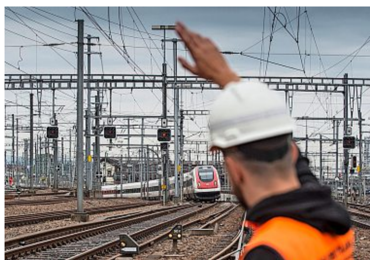
Die Finanzplanung für die Bahn wird kritisiert.