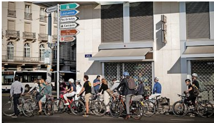
Certains voudraient bannir les cycles trop rapides des pistes cyclables.