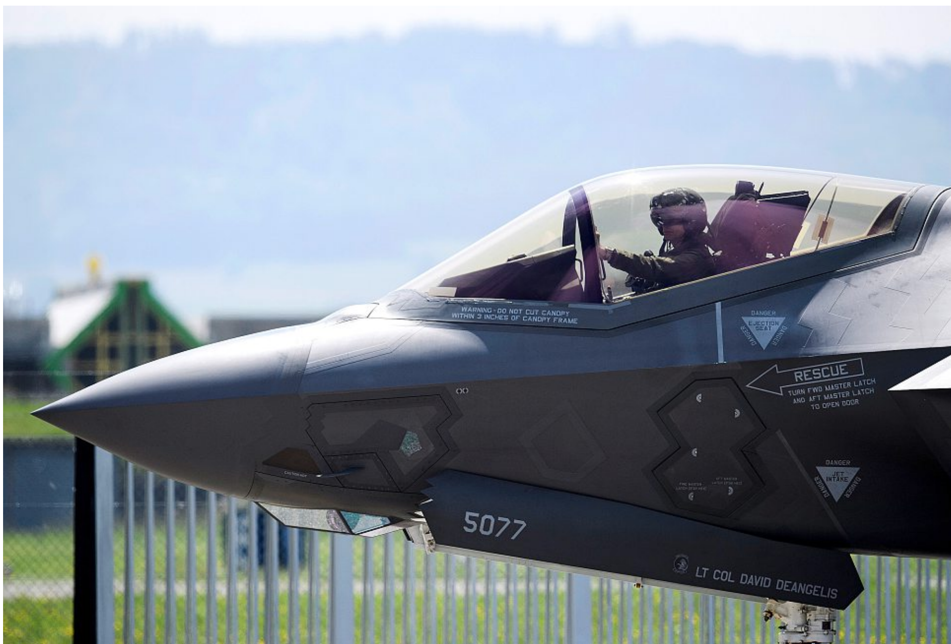
Le F-35A de Lockheed Martin, ici lors d'une présentation à Payerne. L'aérodrome militaire vaudois sera le principal site d'entraînement et d'engagement du nouvel avion de combat.