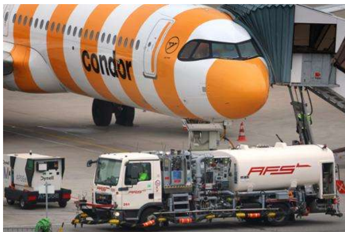
Un véhicule de ravitaillement en kérosène, à l'aéroport de Munich (Allemagne), le 14 avril.