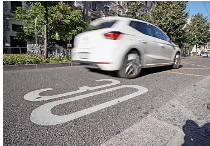
Une zone 30 km/h est en service rue de Saint-Jean. Lucien Fortunati

Le policier arguait aussi que le 30 km/h pourrait lui poser problème lors de l'exercice de son métier, notamment durant les courses urgentes. Mais la justice rappelle que s'il venait à enfreindre les limitations de vitesse dans ce contexte, il ne serait pas