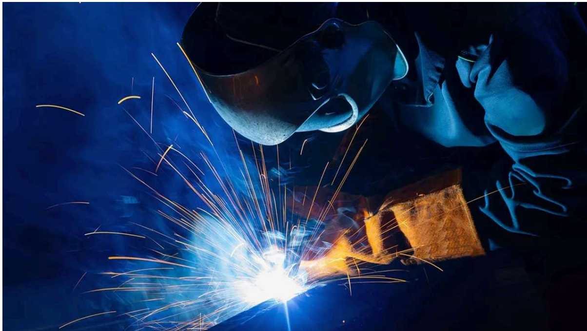
Certains métiers restent difficiles à pourvoir, comme ceux d'aide à domicile, de cuisinier ou encore de soudeur.

Les entreprises prévoient 2,3 millions de recrutements cette année, soit 6,5 % de moins en un an, selon une enquête de France Travail et du Crédoc menée avant la guerre en Iran. Certains métiers restent difficiles à pourvoir.