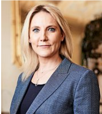
Céline Amaudruz, conseillère nationale (UDC/GE). Yvain Genevay

Céline Amaudruz Pour la conseillère nationale genevoise UDC, il faut faire une analyse coût/opportunité des Bilatérales: «La facilité d'accès au marché européen existe déjà. Mais la reprise de la législation européenne aura un impact sur la productivité des entreprises, surtout des PME. Ce sera davantage de règles, de procédures, de temps consacré à la mise en conformité. Le Conseil fédéral n'a pas chiffré ce coût. Il y a fort à parier que ces accords ne seront pas favorables au renforcement de la productivité suisse.»