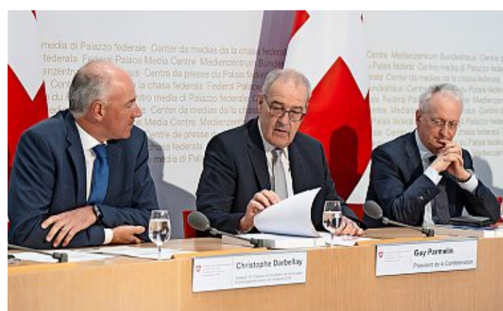
Der Walliser Staatsrat Christophe Darbellay (links) und Bundesrat Guy Parmelin (Mitte) an der Medienkonferenz am 23. März.

Der Ausschuss diene zudem als Schnittstelle zwischen Verwaltung und Bildungsforschung. «Er besteht ausschliesslich aus Verwaltungsvertretungen sowie dem Direktor der SKBF; politische Entscheidungsträger sind nicht vertreten.»