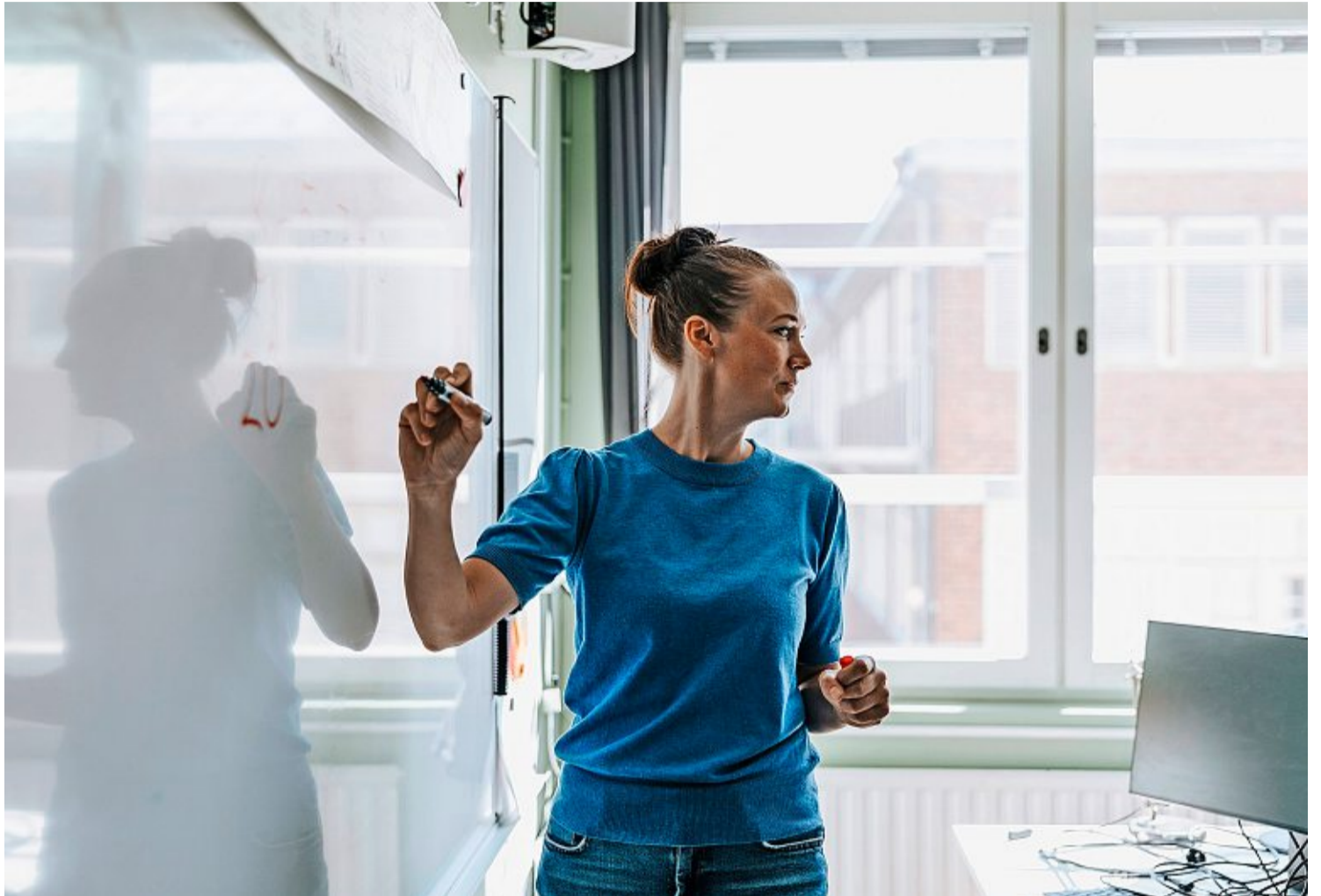
Ist der Bildungsbericht unabhängig oder «eine Art Selbstevaluation von Bund und Kantonen»? Lehrerin an der Wandtafel.

Der Grund: «Dieser direkte Zusammenhang konnte bisher nicht wissenschaftlich bewiesen werden, und viele vorliegende