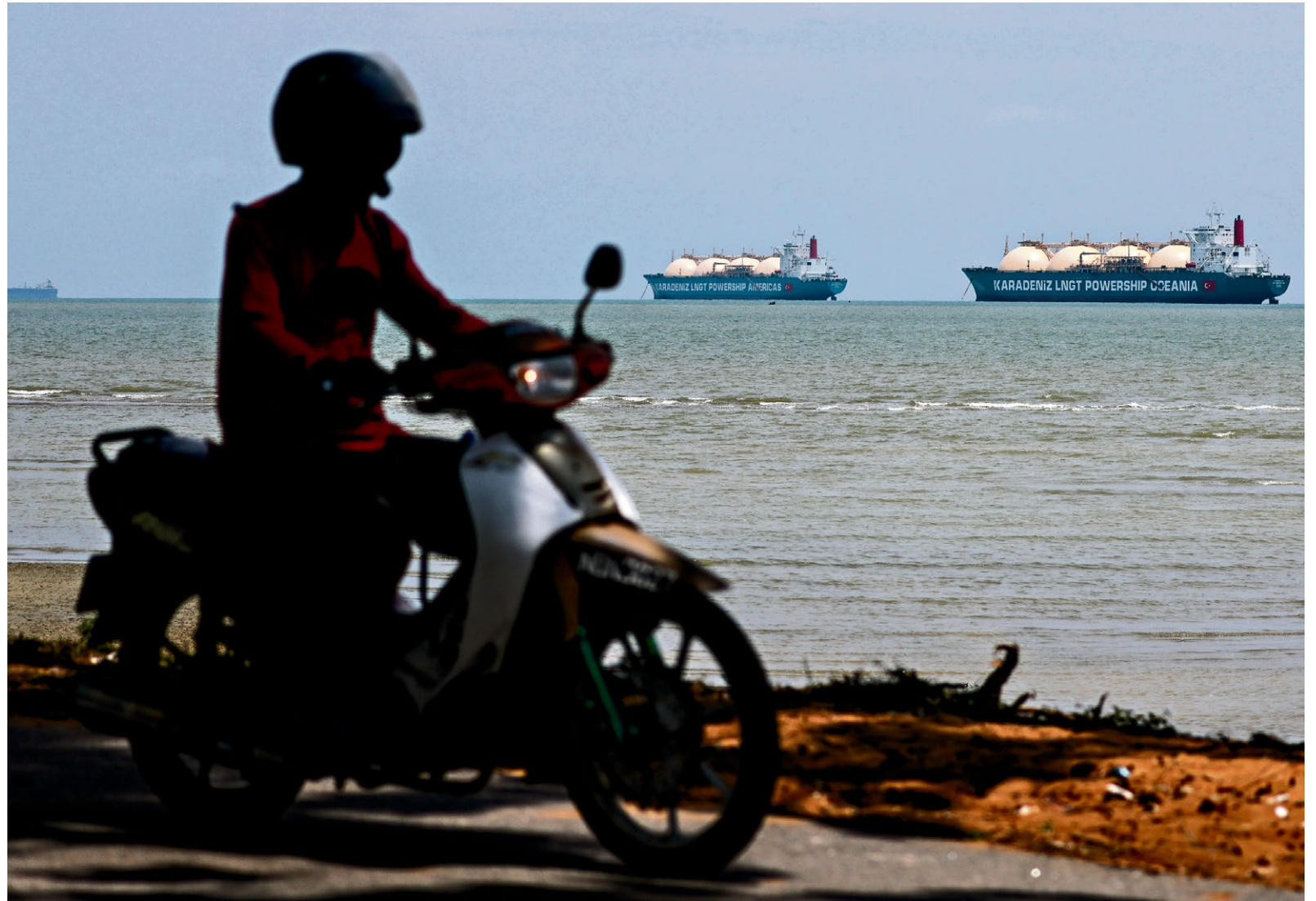
Des tankers de gaz naturel liquéfié dans le détroit de Malacca. Depuis la fermeture d'Ormuz, ce passage est devenu hautement stratégique. (MALAISIE, 15 AVRIL 2026/)

Le choc énergétique secouant l'économie mondiale dans le sillage de la guerre au Moyen-Orient renforce la nécessité d'investir dans des énergies renouvelables pour remplacer les combustibles fossiles, ont affirmé hier les pays hôtes du sommet sur le climat COP31 à l'occasion d'une réunion à Berlin. La crise «nous a montré, une fois de plus, que les combustibles fossiles ne garantissent pas la sécurité de l'approvisionnement énergétique», a dit le ministre turc du Climat et président de la COP31, Murat Kurum. (AFP)