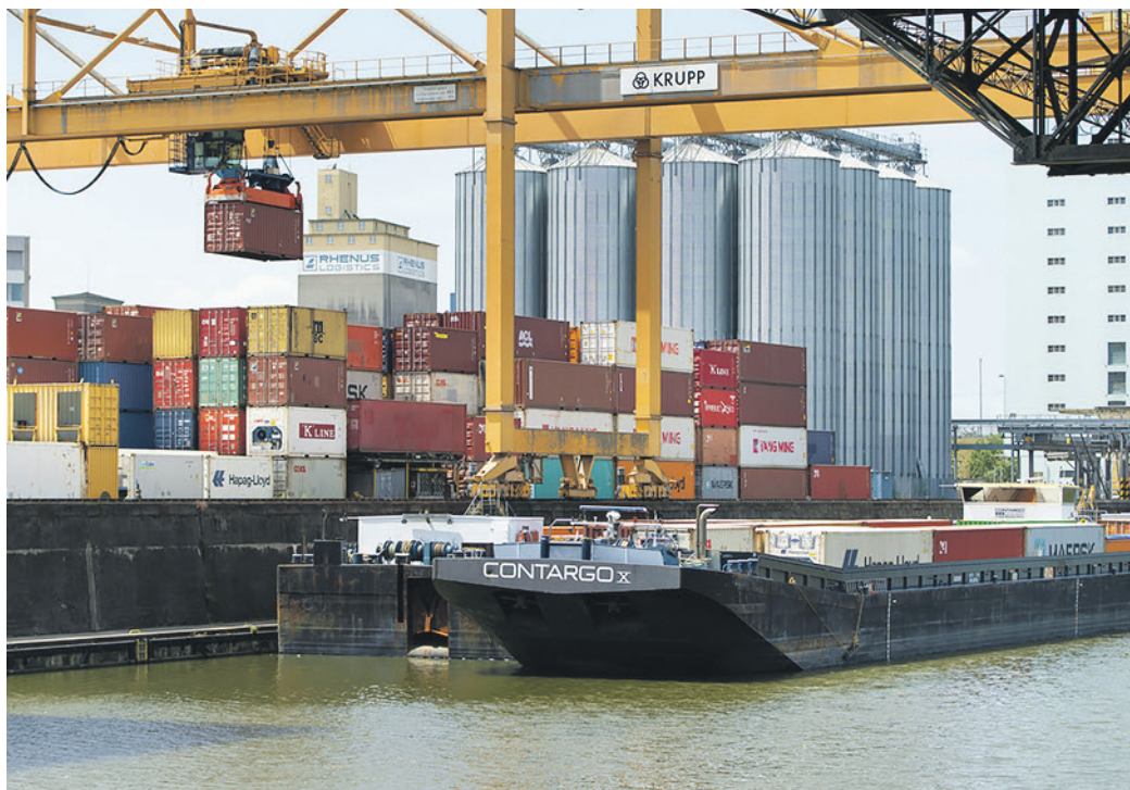
Port de Bâle. Les exportations désaisonnalisées se sont repliées de 4,2% à 66,9 milliards de francs.

Le chiffre d'affaires avec l'Amérique du Nord a flanché de 14,4%. Ici, les Etats-Unis ont lourdement pesé dans la