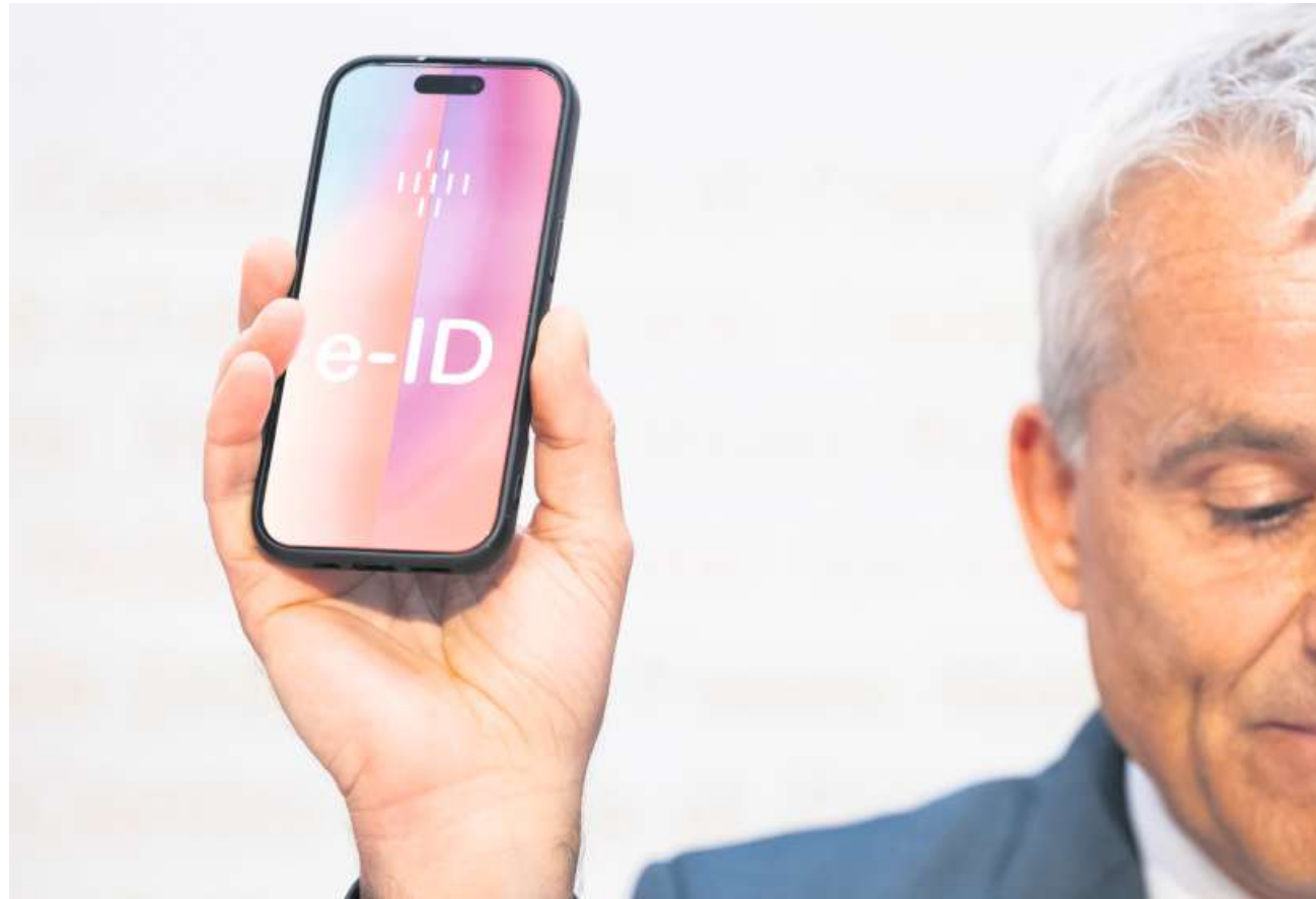
Bundesrat Beat Jans zeigt vor dem Urnengang letzten Herbst die E-ID-App.

Öffentlich ersichtlich war die Spende allerdings schon früher: Ab Ende August wurde sie auf der Plattform «Politikfinanzierung» der Eidgenössischen Finanzkontrolle (EFK) angezeigt. In diesem Transparenzregister werden seit einigen Jahren politische Spenden öffentlich gemacht. Drei Bundesrichter des fünfköpfigen Gremiums vertraten die Meinung, dies sei entscheidend. Der Zeitpunkt eines Medienberichtes dürfe für den Ablauf einer Frist nicht bestimmend sein. Anders als die «NZZ am Sonntag» sei das EFK-Verzeichnis ohne Kostenbarriere einfach und in allen Landessprachen zugänglich, argumentierte einer der Richter.