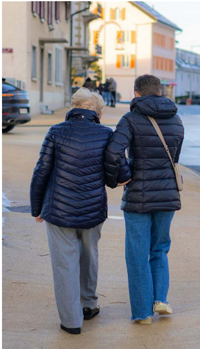
Les retraités peuvent rester sereins. Confrontés à des secousses, les investissements opérés sur leurs rentes sont diversifiés et devraient être fiables sur le long terme.

Les caisses de pension ne cèdent pas non plus à la panique. Et cela malgré une performance moyenne de -2,63% en mars selon une analyse de la banque UBS. «Les événements géopolitiques sont graves, mais ils ne nous désarçonnent pas. Les derniers mois ont été compliqués, mais nous ne vivons de loin pas un krach», expose Lu-