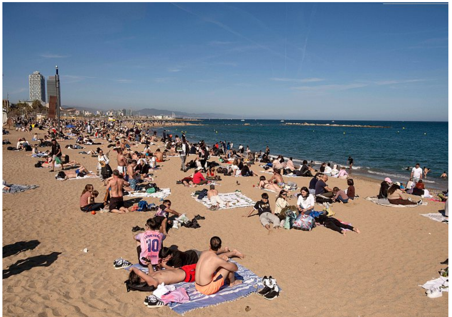
La plage de la Barceloneta en Espagne, ici au début de ce mois d'avril, est très prisée des touristes et des locaux.