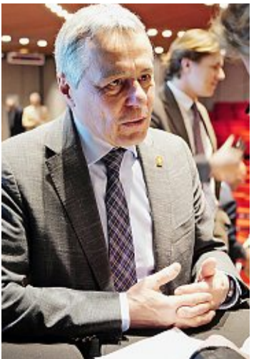
Le conseiller fédéral Ignazio Cassis en interview.

Les syndicats ont longtemps craint une explosion du nombre de travailleurs détachés. Comment s'assurer que cette main-d'œuvre reste sous contrôle? C'est une inquiétude compréhensible. Les syndicats ont participé à l'élaboration et accepté quatorze mesures destinées