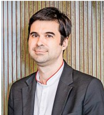
Samuel Bendahan, conseiller national (PS/VD), coprésident du groupe socialiste.

Samuel Bendahan «Si nous voulons que l'Europe respecte nos choix, nos droits, nous devons respecter les siens, estime le conseiller national socialiste vaudois. Il ne s'agit pas d'une violation de notre souveraineté.» L'êtu souligne que via ces accords, avantageux économiquement, il ne s'agit pas seulement de défendre l'industrie d'exportation suisse. Il s'agit surtout «de se battre contre la solitude: l'isolement international a un coût colossal. Avoir des partenaires fiables et démocratiques est notre seul salut.»