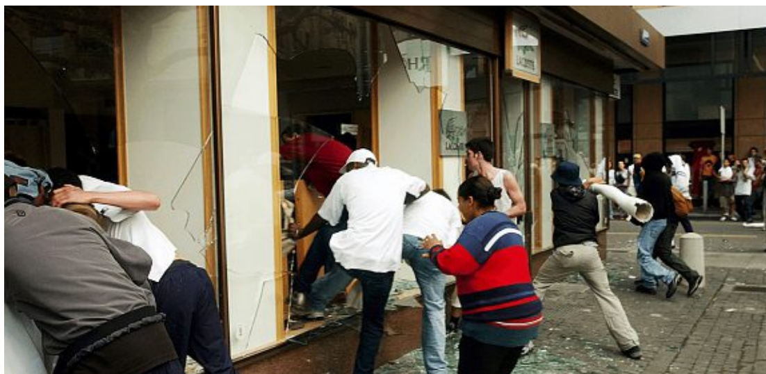
Le souvenir est encore vif. En 2003, en marge du G8, des casseurs avaient pillé des magasins de la ville, comme ici celui de la marque Lacoste, à la place de la Fusterie, dans les Rues-Basses.