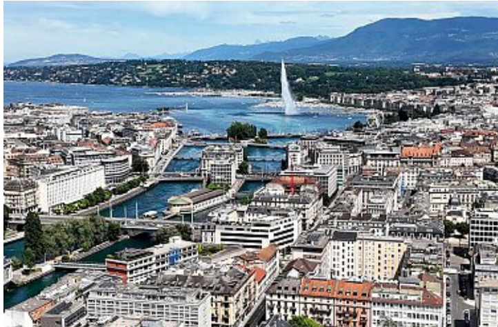
À Genève, les autres langues nationales – l'allemand et l'italien – arrivent derrière l'anglais, le portugais et l'espagnol. Lucien Fortunati

Celle des personnes monolingues progresse à 74% (contre