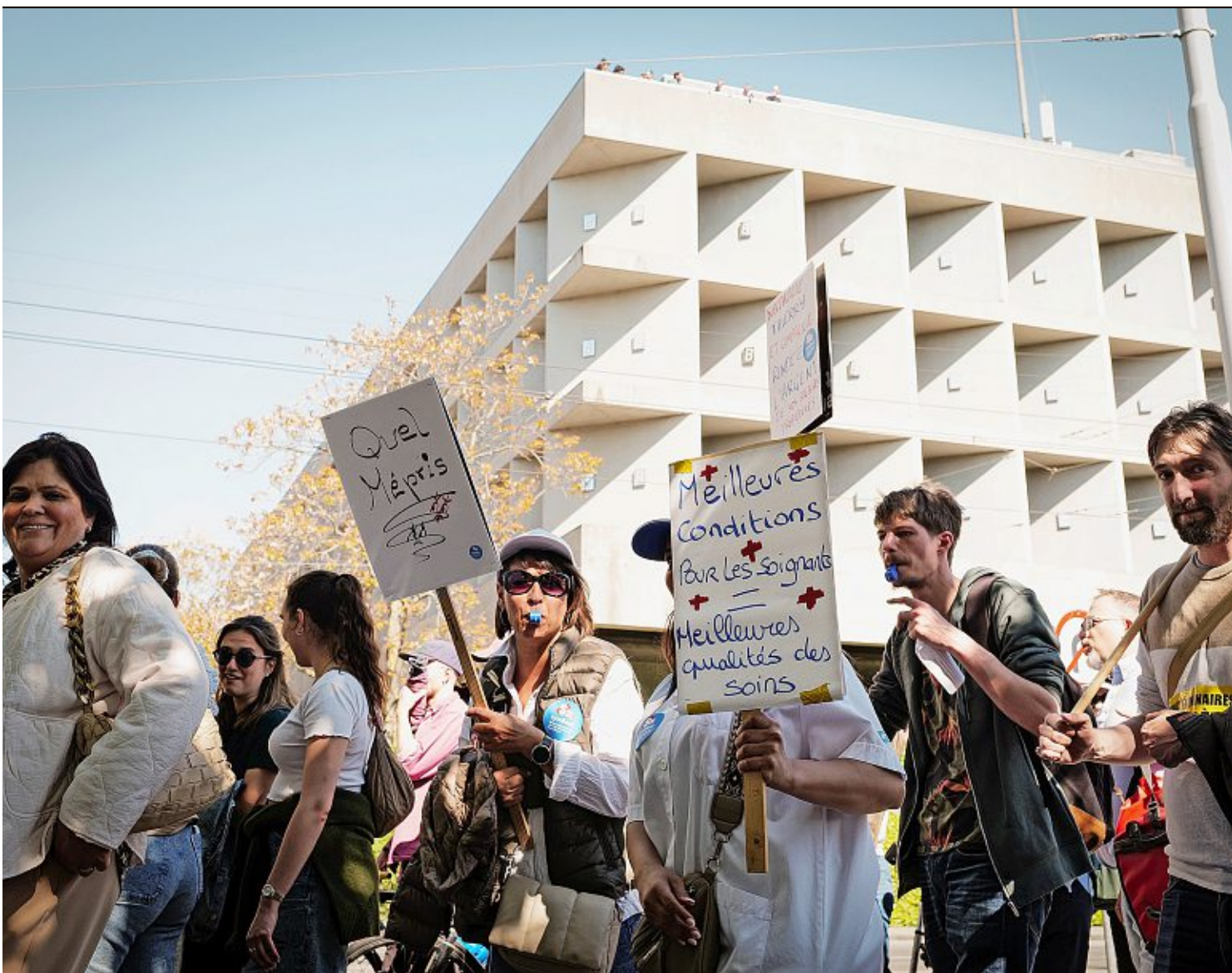
C'est la quatrième fois depuis le mois de novembre que le personnel de la fonction publique descend dans les rues.