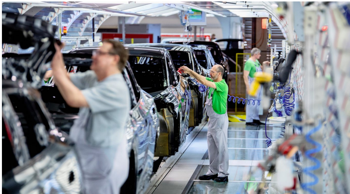
Der Lack ist ab: VW-Produktion in Wolfsburg.

Nun gibt es höhere Renten für Mütter, tiefere Mehrwertsteuern für Restaurants, Subventionierung von Agrardiesel,