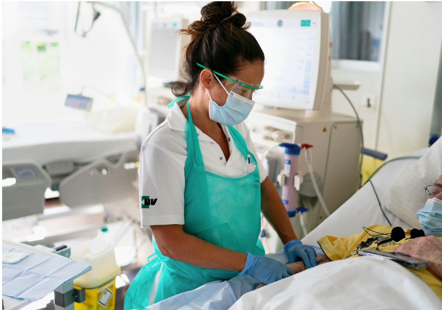
410'000 – niemand hat so viele Grenzgänger, wie die Schweiz: Krankenschwester im Spital Lausanne.

Dies aus dem einfachen Grund, weil künftig Grenzgänger ihr Arbeitslosengeld von jener Arbeitslosenkasse erhalten sollen, in die sie Beiträge eingezahlt haben. Heute werden diese Gelder von den Arbeitslosen-