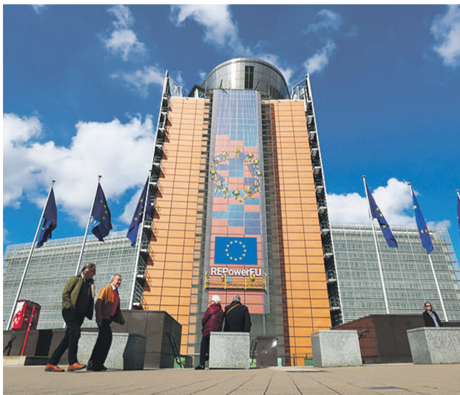
Zone euro. La Commission européenne a mené une consultation publique sur la compétitivité des banques et autres acteurs financiers.

Le directeur général de la banque aux trois clés, Sergio Ermotti, avait déclaré fin mars qu'il resterait en poste au moins jusqu'en avril 2027. Selon des sources initiées citées ce mois-ci par l'agence Reuters, le Tessinois pourrait voir son mandat prolongé jusqu'à la fin de l'année prochaine, en raison du changement de réglementation bancaire et en l'absence d'une solution de succession interne. ■