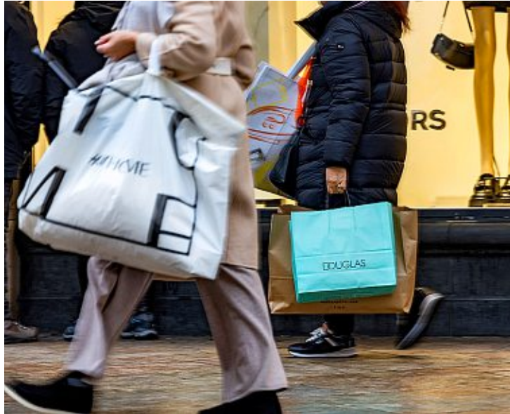
La gauche genevoise s'érige contre l'assouplissement des horaires des magasins en l'absence de condition collective de travail. P. Albouy

L'intervention tombe à un moment particulier à Genève: le 14 juin, les citoyens sont appelés à voter en faveur d'un assouplissement de la loi sur les horaires