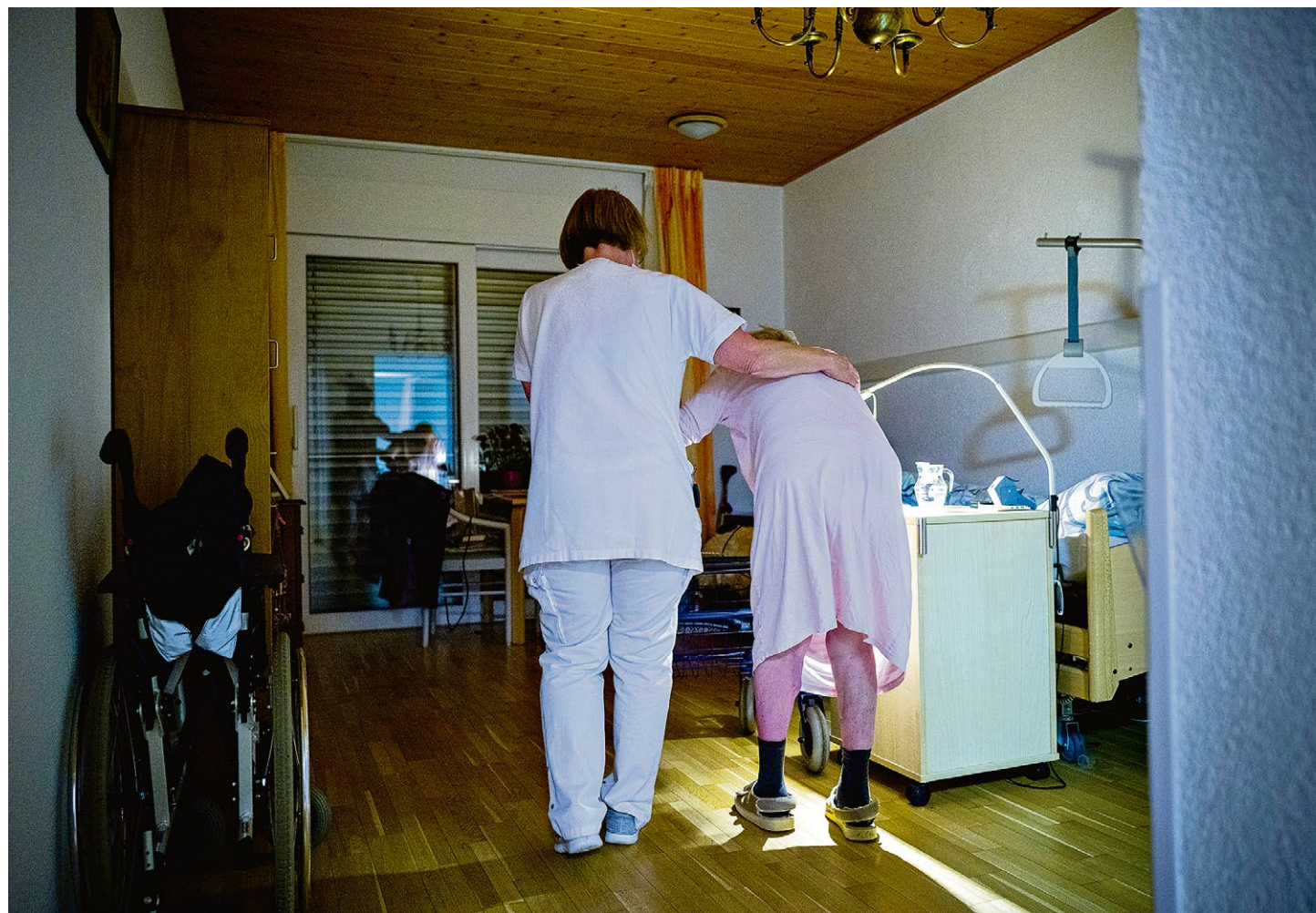
Le nombre de personnes de plus de 85 ans va doubler dans les prochaines années. Qui va s'en occuper en EMS? (BLONAY, 26 JANVIER 2021/YVES LERESCHE POUR LE TEMPS)

Car le problème n'est pas seulement celui des infrastructures, mais surtout celui des ressources humaines. «Aujourd'hui, on ouvre des lits en EMS uniquement quand on arrive à recruter.» Et ce recrutement se fait très largement à l'étranger. «Plus de 80% de nos collaborateurs ne sont pas