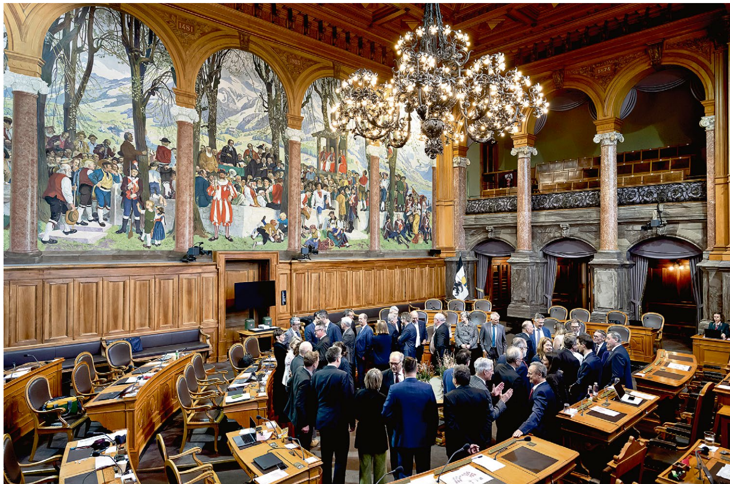
Dans la salle du Conseil des Etats. Si la notion même de «demi-canton» a été supprimée de la Constitution depuis le 1er janvier 2000, Nidwald, Obwald, les deux Appenzell et les deux Bâle ne disposent toujours que d'un siège à la Chambre des cantons et voudraient être reconnus à part entière. (BERNE, 20 MARS 2026/ANTHONY ANEX/KEYSTONE)

Ces revendications ne sont pas nouvelles. Régulièrement, des